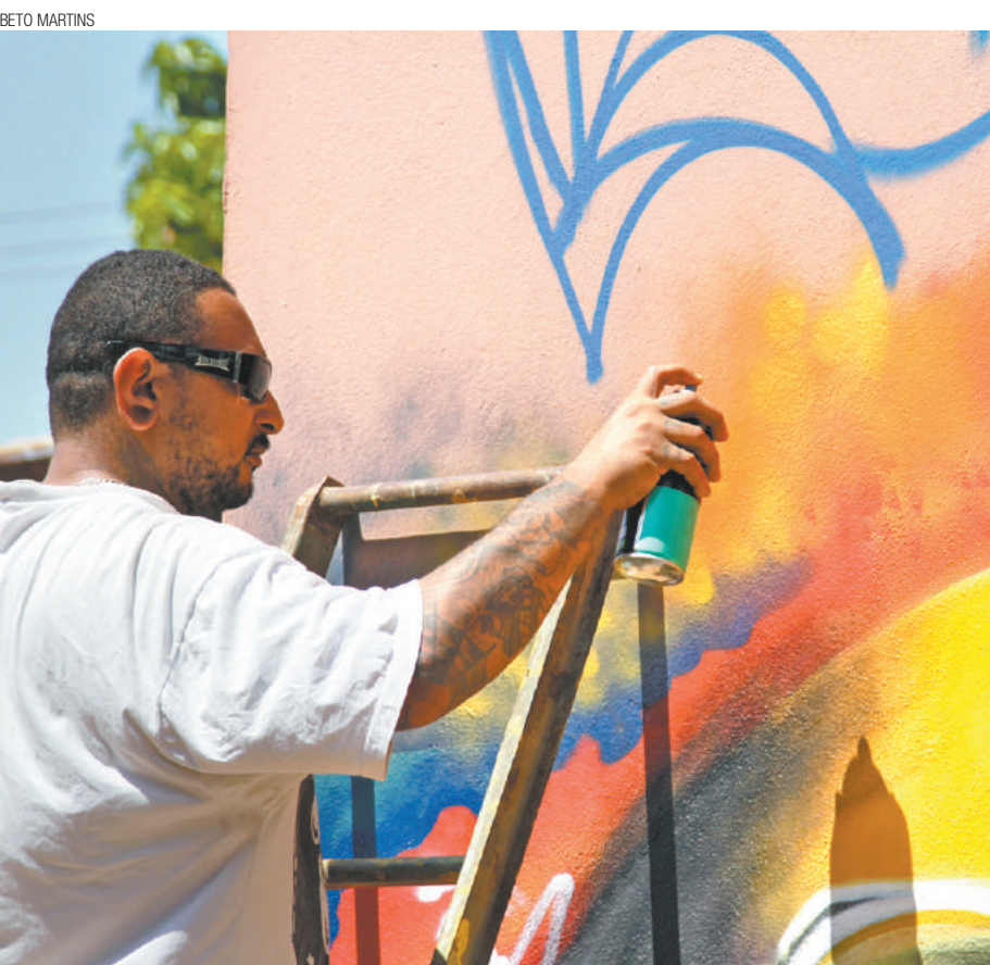
Bom Clima - Grafiteiros se reuniram com a comunidade e espaço já recebe novos visitantes

Decisão ocorreu em reunião no Ministério Público Estadual (MPE) entre o promotor de Justiça Nadim Mazloum, com representantes do Stap (sindicato da categoria) e do Saae. Sexta parte continua suspensa para os celetistas da autarquia municipal. Pág. 3