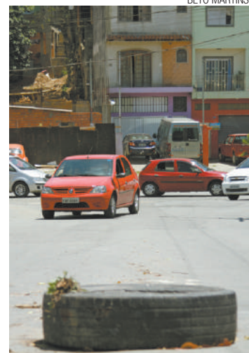
Trânsito - Pneu foi colocado na via pelos moradores da região

Este bueiro é um problema constante na região, já que normalmente tem vazamento de esgoto e deixa