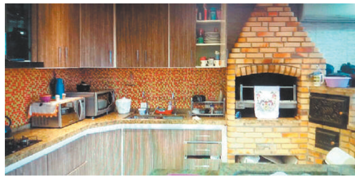
Patrimônio - Suspeito morava em uma mansão no litoral sul de SP