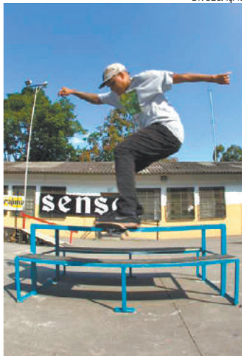
Manobra - Modalidade é vista pela primeira vez na cidade