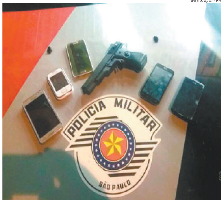
Objetos - Policiais encontraram cinco celulares e uma imitação de arma

Os policiais abordaram o adolescente após identificarem que ele possuía as mesmas características informadas pelas vítimas. Cinco pessoas foram roubadas pelo suspeito, de acordo com a Polícia Militar. A ocorrência foi registrada no 7º DP (Região São João).