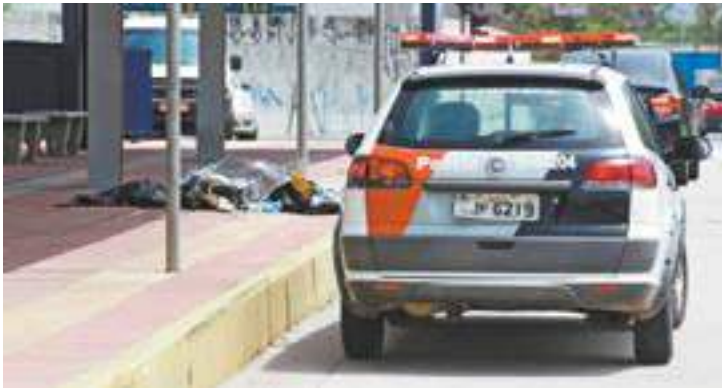
Tragédia - Metalúrgico perdeu o controle da moto e colidiu contra obstáculo