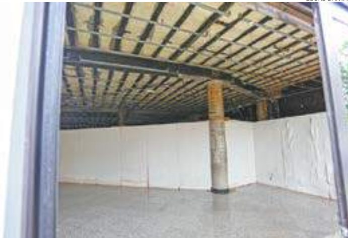
Insalubre - Para categoria, prédio apresenta má condição de trabalho

Além da manutenção salarial, os procuradores lutam por melhores condições de trabalho. O prédio da Secretaria de Assuntos Jurídicos, no Centro, local de trabalho da categoria, sofreu um incêndio em julho do ano passado. Desde então, os procuradores reclamam que o imóvel está em péssimo estado de conservação.