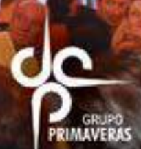
Foto do evento em 01/11/2015 no Cemitério Primaveraes.