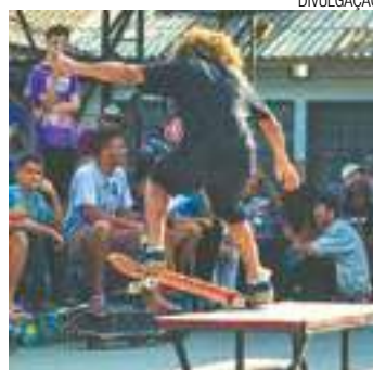
Radical - Prática do skate resgata jovens e atrai a comunidade