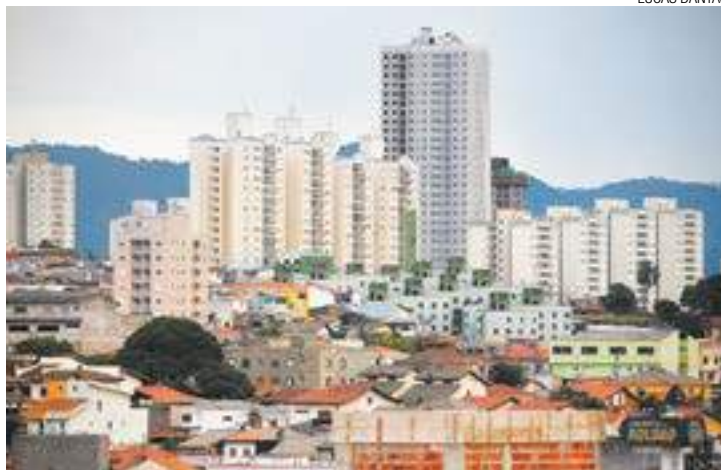
Índice - Cidade ficou na 5ª posição entre as que mais tiveram aumento

Os dados são de pesquisa realizada pela DMI-VivaReal, que estudou o preço médio de 30 cidades. Entre elas, Guarulhos é a quinta com maior variação de preços. "Investidores perceberam que a cidade tinha um espaço para crescimento