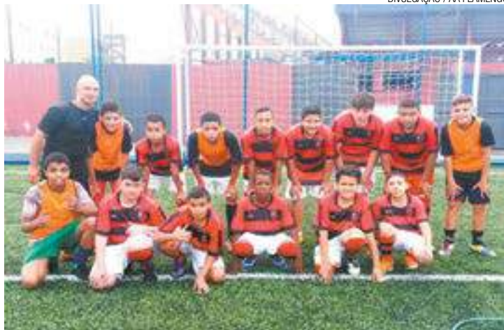
Quadra - Funciona no estacionamento do Estádio Antônio Soares de Oliveira

“A gente tem uma demanda muito grande de jovens. Nem todos têm condição ainda de disputar um campeonato de alto nível. Nosso