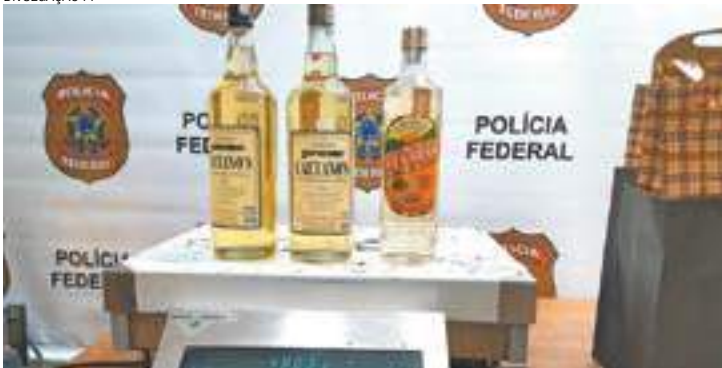
Disfarce - Garrafas de cachaça eram usadas para armazenar cocaína líquida