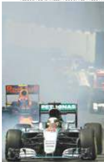
Susto - Tricampeão mundial travou os pneus logo na largada