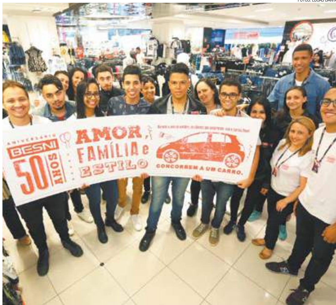
História de sucesso - Funcionários buscam, diariamente, ajudar os clientes a se sentirem cada vez melhores

A rede social é uma grande aliada para aproximar os consumidores da marca e atender as mais diversas necessidades, seja com dicas de looks, apresentação de novas coleções, respondendo dúvidas ou divulgando promoções. Os planos de expansão para os próximos anos incluem a inauguração de lojas no Estado de São Paulo, onde a empresa atua desde a inauguração, e conquistar novos clientes.