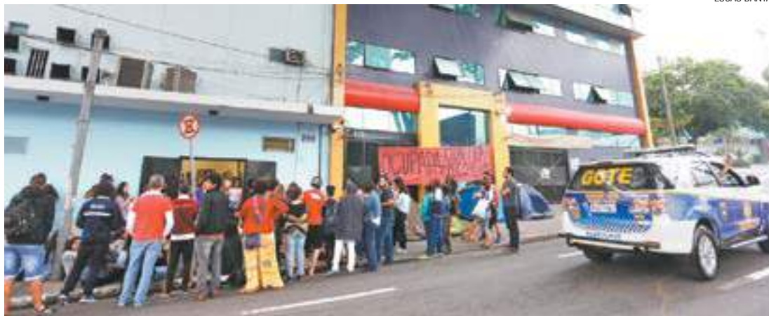
Churrasquinho - Calçada em frente ao prédio do Legislativo, na Rua Luiz Faccini, virou espaço de protesto ontem