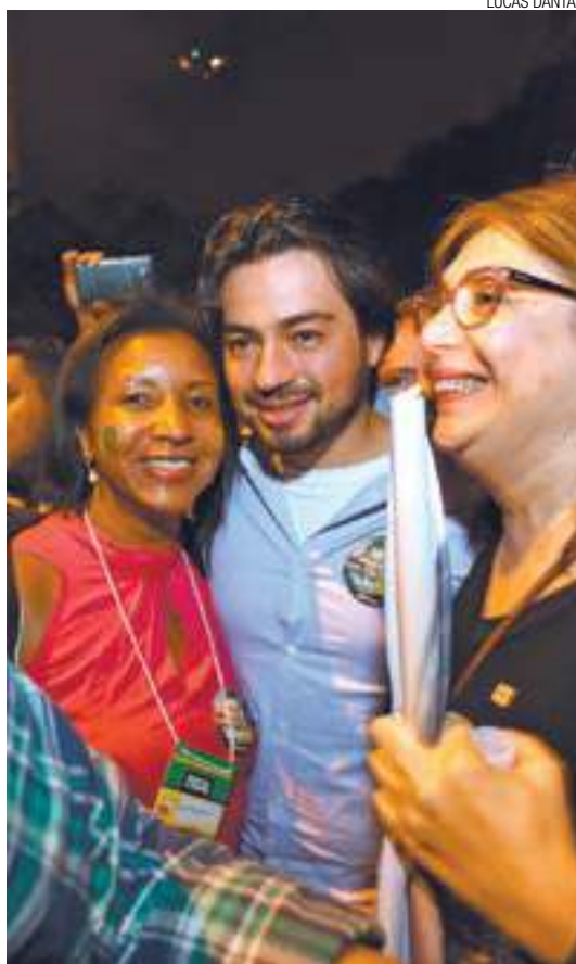
Festa - Eleitores de Guti lotaram a Av. Paulo Faccini

Mais de 200 mil não compareceram às urnas; votos brancos e nulos somaram 17,56%