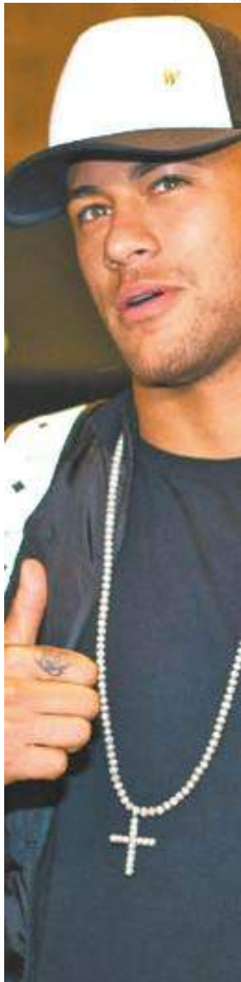
Clássico - Craque irá participar de dois treinos antes de encarar a Argentina