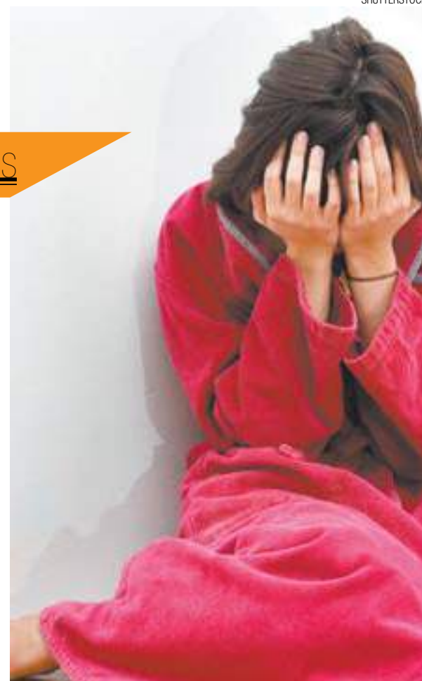
Violência - Maioria das vítimas não registra os crimes

Ela acrescentou também que, por conta da vergonha e medo de denunciar, muitos crimes sexuais deixam de constar nas estatísticas, que "não representam a realidade". "Falta informação para conscientizar, principalmente meninas, sobre os riscos que elas correm. Vivemos em uma sociedade machista e é importante que elas tenham consciência disso e saibam se defender". Mesmo não representando a realidade, dados da SSP registraram 7.306 casos de estupro entre janeiro e setembro deste ano no estado. Considerando o período, é como se 26,6 pessoas fossem estupradas diariamente.