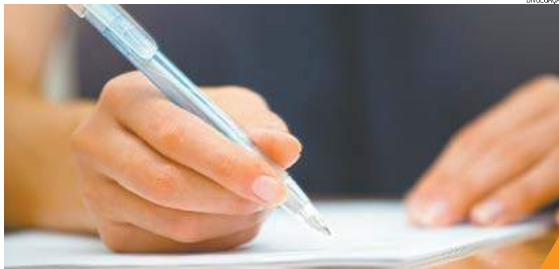
Abandono - De acordo com a Educação, desistências oscilaram entre 2,3% em 2010, e 5,1% em 2014

5,5 mil alunos se inscreveram no Mova em 2010