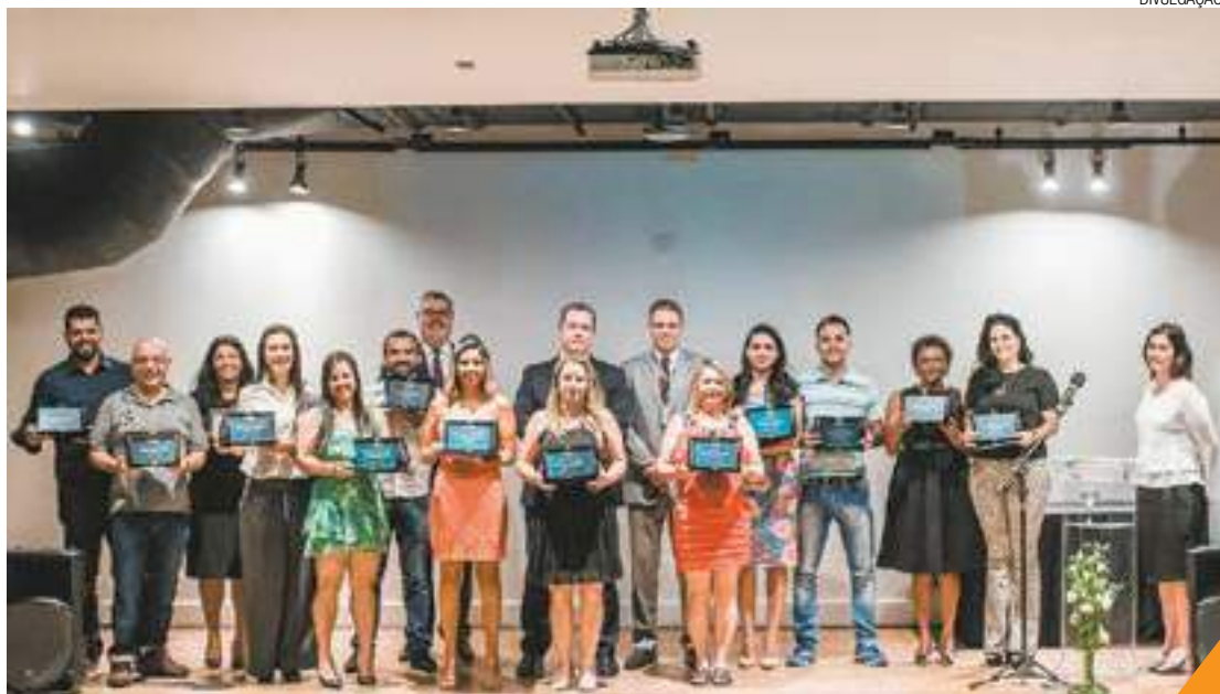
Participação - Programa recebe inscrições de 96 microempreendedores; 83 assinaram termo de adesão

De maio a agosto deste ano foram realizadas palestras, oficinas, cursos e consultorias envolvendo temas como Finanças, Administração, Jurídico, Marketing, Qualidade, Estoque, Internet, entre outros assuntos, totalizando uma carga de aprendizagem de 65 horas. Ao final do programa, 20 empresas apresentaram um plano de melhoria do seu negócio, sendo que 13 foram premiadas.