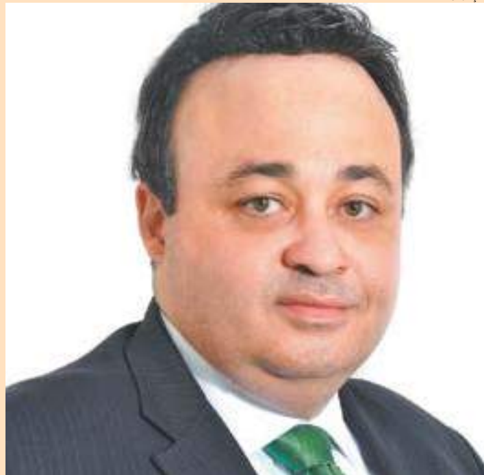
José Lima - Independente da idade, todos são potenciais doadores

O médico diz que é possível que aquela pessoa com morte encefálica pode ajudar esses outros pacientes. A gente joga num software as características para ver