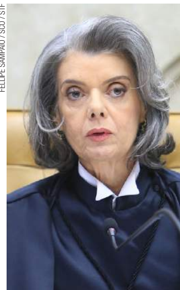
Reflexão - Carmén Lúcia explica alto preço do sistema prisional

surpresa, e a ideia é inspecionar todos os Estados.