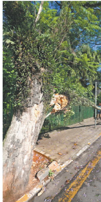
No Centro - Árvore caiu sobre a grade do Fórum guarulhense