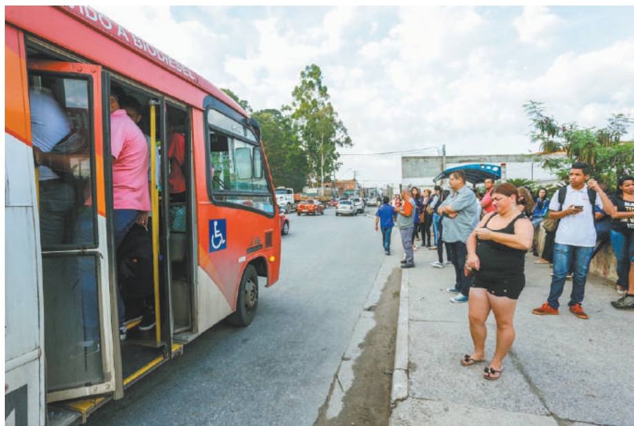
Lotado - Término da paralisação deu início ao 'empurra-empurra' por espaço nos ônibus