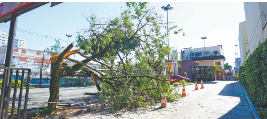
Próximo - Do mesmo local, uma árvore caiu em frente a uma rede de lanches; não houve feridos no acidente