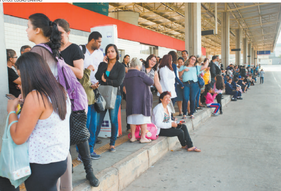
Ansiedade - Nos terminais, passageiros esperavam pela chegada dos coletivos municipais