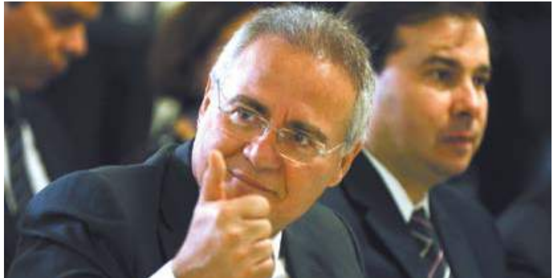
Prorrogação - No Senado, Renan Calheiros (PMDB) quer novo prazo entre 1º de fevereiro a 30 de junho de 2017

“Esse número poderia ter sido bem maior. Muitas pessoas deixaram para a última hora e tinham dúvidas se teriam algum problema por conta da movimentação do dinheiro no exterior. Mesmo com o aconselhamento dos advogados, muitas pessoas deixaram para a última hora sem pensar que existe um prazo para comunicação entre as instituições financeiras de ambos os países”, disse Renata.