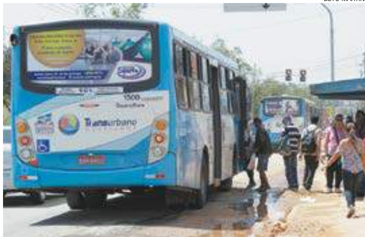
Reajuste - Expectativa é que tarifa aumente de R$ 3,80 para até R$ 4,40

Para efeito de cálculo, a Secretaria leva em conta os custos variáveis, como combustível e lubrificantes, e fixos, que envolvem recursos humanos e despesas administrativas. A tarifa ideal é uma média entre o que deveria custar a passagem dos micro-ônibus, que foi estimada em R$ 5,02, e das viagens nos coletivos das concessões, prevista em R$ 4,71.