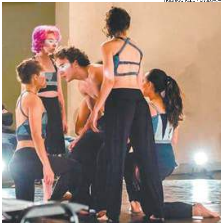
No palco - "Se é que um dia a gente vai se olhar", da turma de Dança IV

A dramaturgia é composta pela relação dos corpos em coro e solos com interação no espaço, buscando formas de compartilhamento por meio da dinâmica de aproximação e distanciamento em cena. Trata-se de abertura de processo, caracterizando-se em momentos em que o coletivo da escola mostra percursos de trabalho, promovendo relação com o público, entendendo-a como parte fundamental da arte contemporânea a da obra aberta, processual. Assim, o caráter de "espetacularização" é substituído pelo conceito e prática do encontro, pressuposto fundamental da completude artística. Realizadas a cada módulo, as atividades são essenciais à formação crítica dos aprendizes-artistas. A temporada irá até 17 de dezembro.