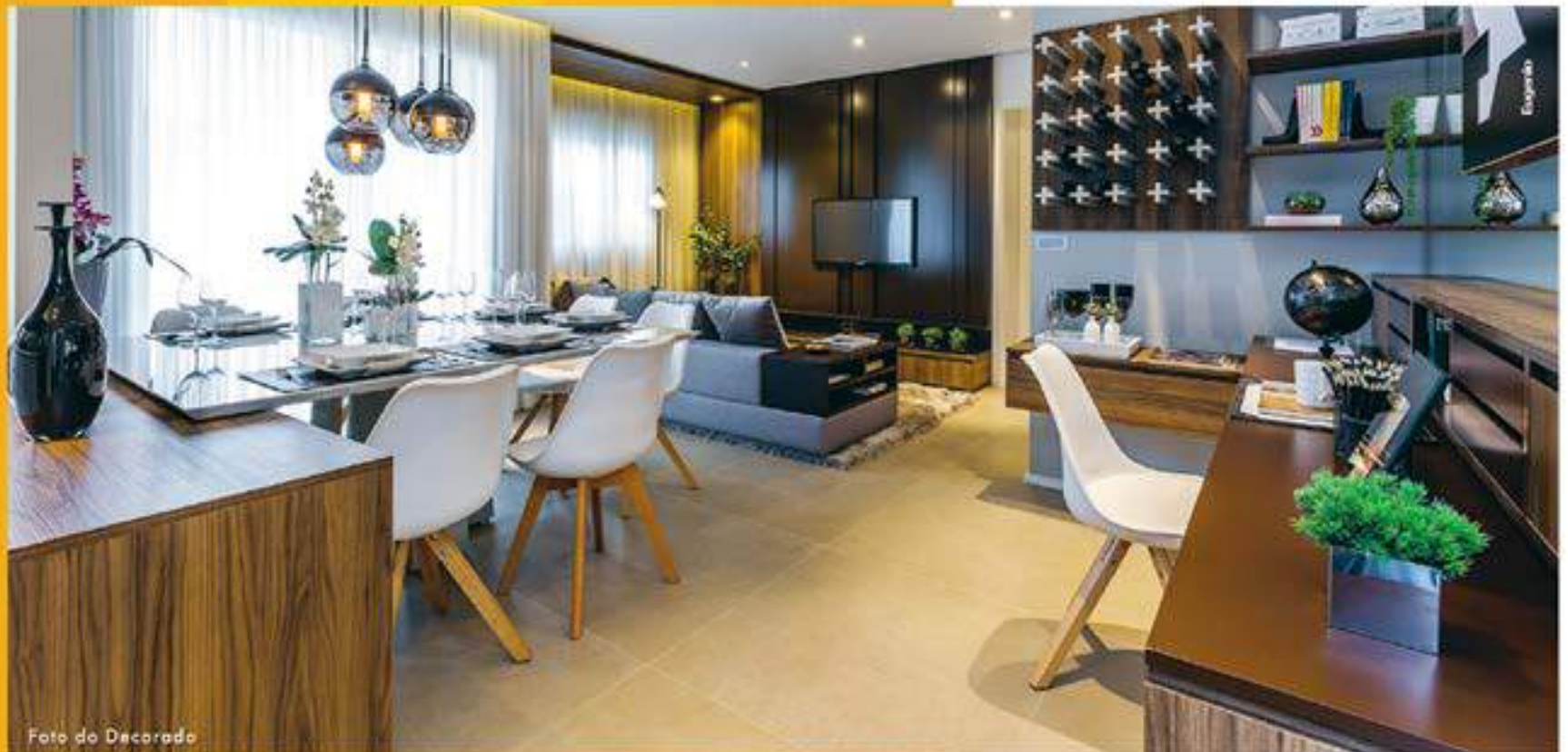
Foto do Decorado