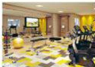
Perspectiva Ilustrada do Fitness