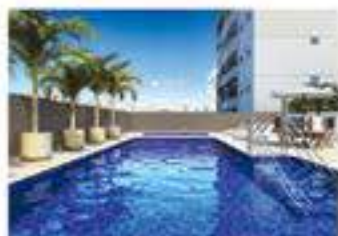
Perspectiva Ilustrada da Piscina