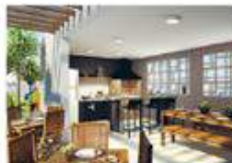
Perspectiva Ilustrada da Churrasqueira

APTOS. 2 DORMS. COM SUÍTE E VARANDA GOURMET LAZER COMPLETO