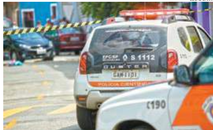
Região Taboão - Polícia científica analisa local onde jovens foram mortos

De acordo com a Polícia Federal (PF), o entorpecente foi encontrado após a bagagem do estrangeiro ser revista. O homem, que recebeu voz de prisão por tráfico internacional de drogas, havia ingressado no Brasil beneficiado pela Lei do Refúgio. O preso foi conduzido ao presídio estadual onde permanecerá à disposição da Justiça.