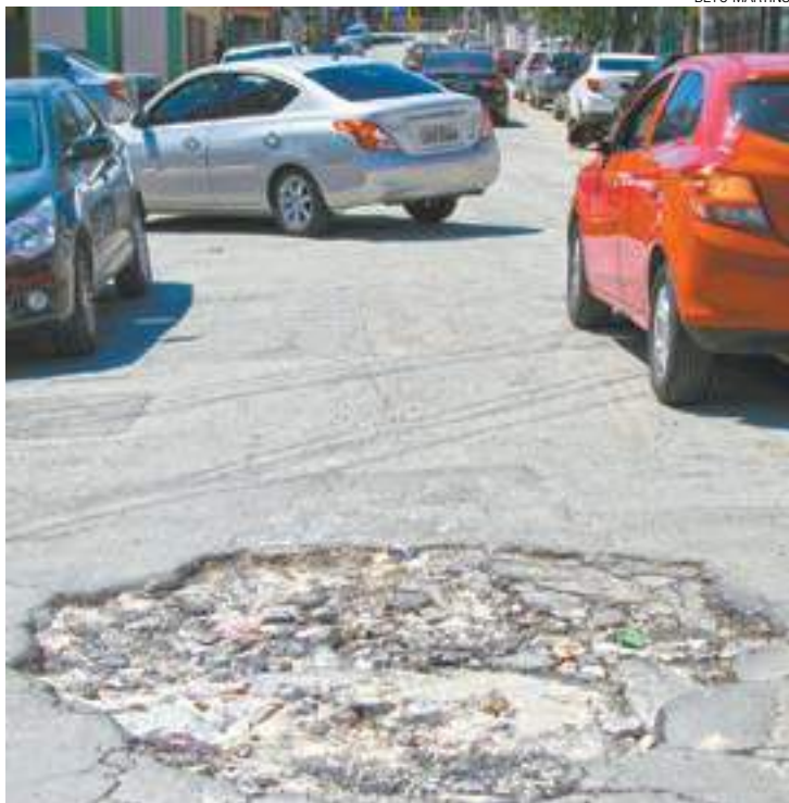
Obstáculo - Abertura atrapalha trânsito e incomoda os moradores