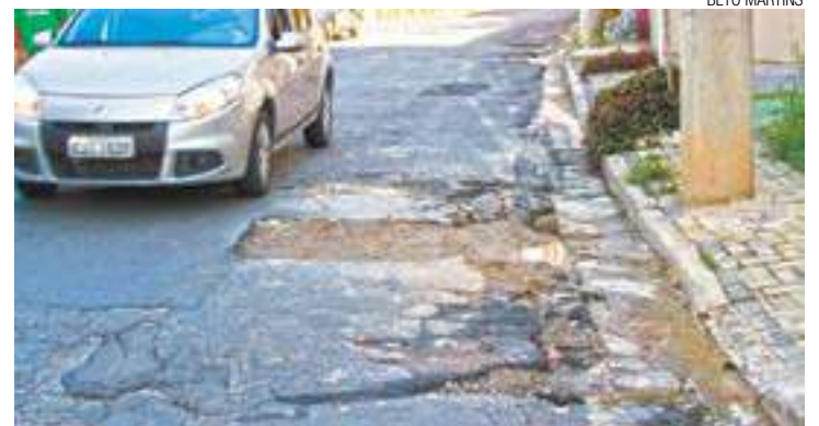
Sofrimento - Moradores queixam-se do problema há pelo menos três anos

Provável mina d'água no meio da via dificulta reparos