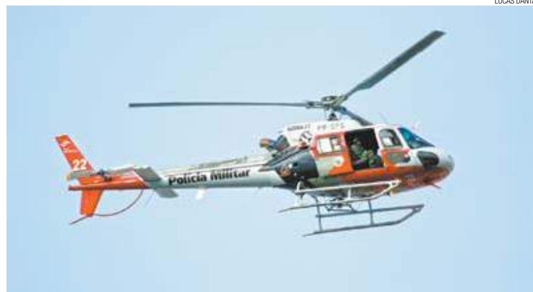
Olhos atentos - Helicóptero Águia 22, da Polícia Militar, sobrevoa a Grande a Grande SP atrás de ocorrências