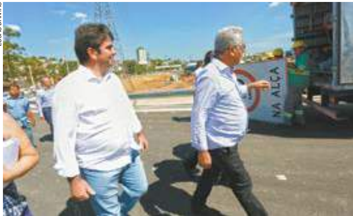
Atraso - Obras deveriam ter sido entregues até setembro de 2016