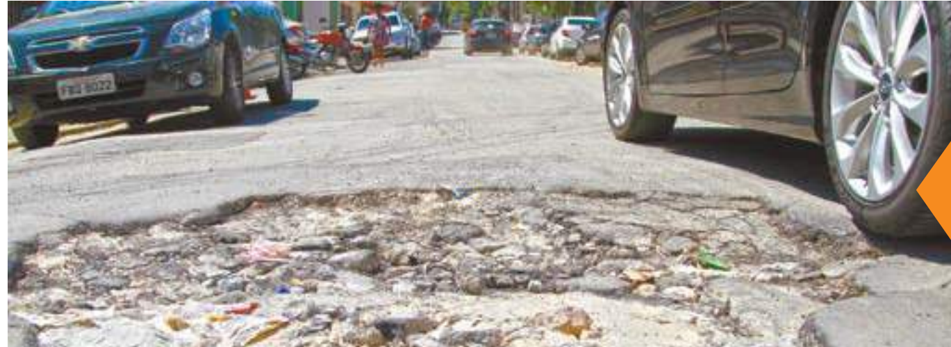
Cratera - Abertura atrapalha a circulação de veículos, acumula sujeira e água da chuva; Proguaru não respondeu à reportagem desta Folha