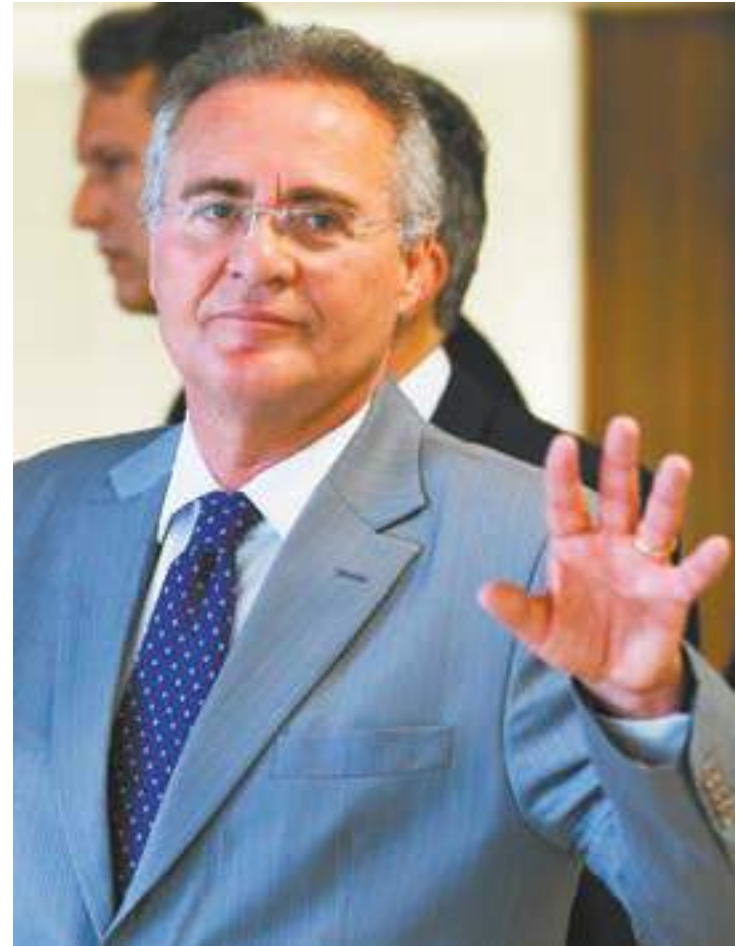
É guerra - Renan esnoba Marco Aurélio e o ataca supersalários no STF

Técnicos do Senado consideram que a decisão do Supremo é soberana