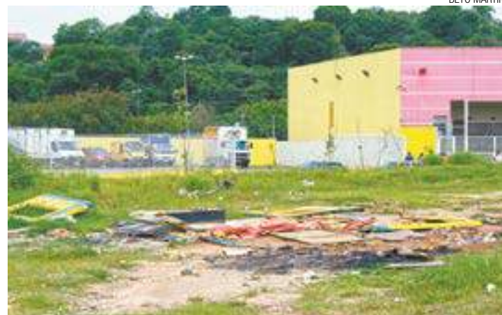
Total abandono - Área no Jd. Adriana mais parece um terreno baldio