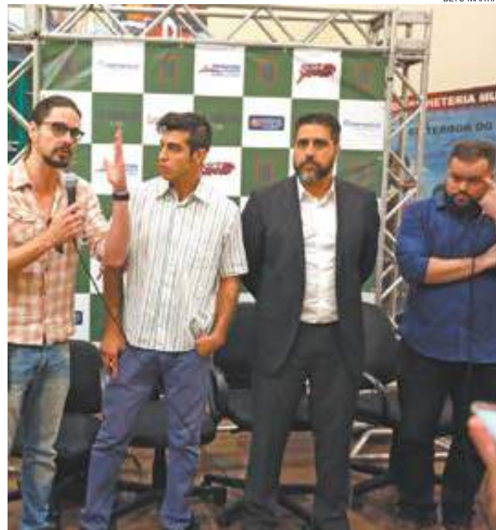
Lançamento Pré-estreia aconteceu ontem no Cinemark do Internacional

Cinemark do Shopping Internacional de Guarulhos, hoje, às 19h e às 21h. Rodovia Presidente Dutra, Saída 225, s/n, Itapevica (Região Centro). Produção: Perigo Filmes