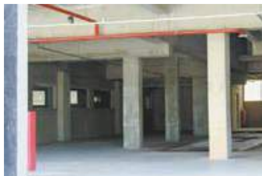
Acesso - Instituto pode ser acessado pela Maternidade JJM ou pela Viela Leon, no Paraventi (Região Centro)