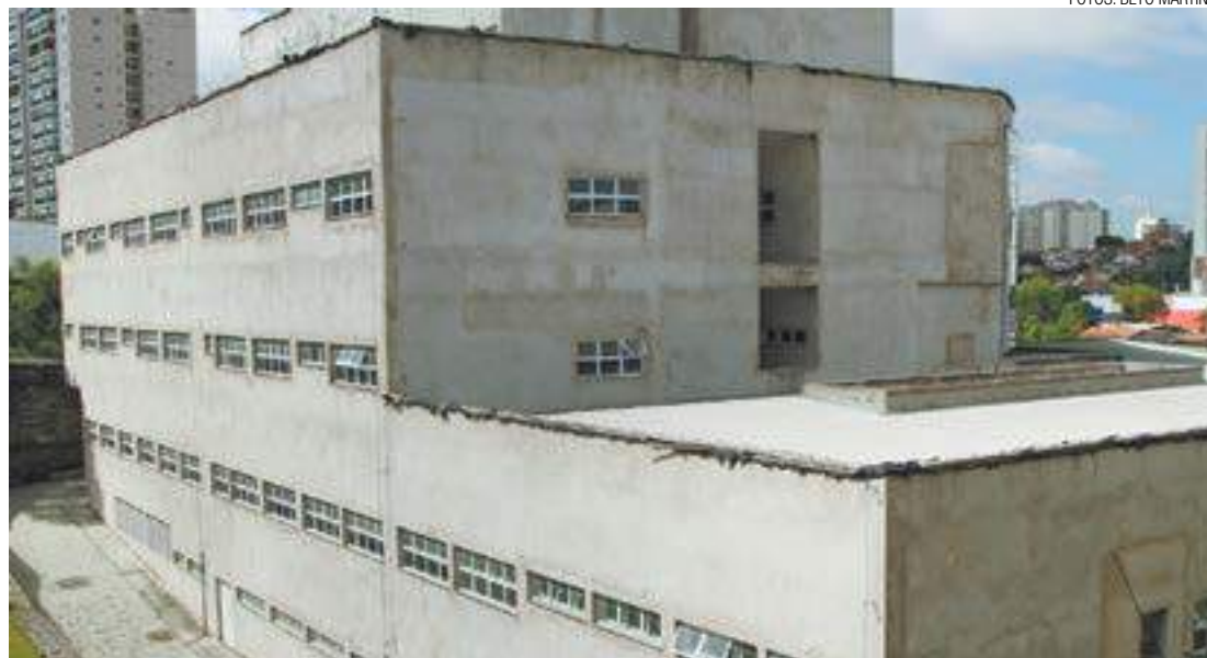
Acabamento - Para finalizar obra é necessário mais um ano de trabalho para pintar, energizar e acertar detalhes