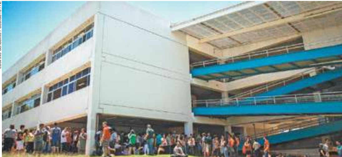
Sonho - Universitários que estão em faculdades particulares também podem migrar para cursos públicos