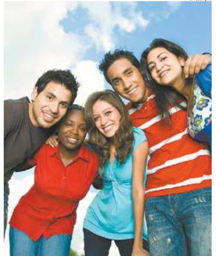
Diversidade - Universidades brasileiras acolhem diferentes tipos de alunos

UNINTER CENTRO UNIVERSITÁRIO INTERNACIONAL