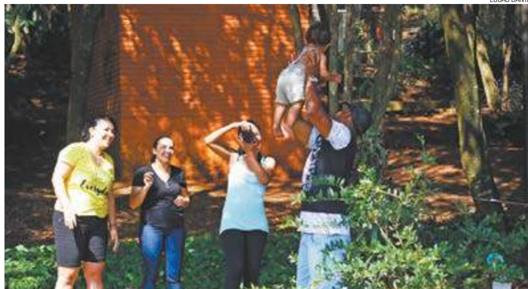
Retrô - Nas décadas de 1960 e 1970 era muito comum fazer álbum de fotos dos filhos; a mania voltou à moda