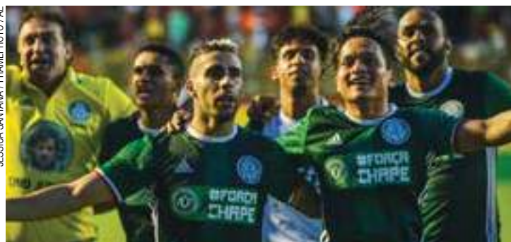
Solidariedade - Jogadores do Palmeiras homenagearam a Chapecoense