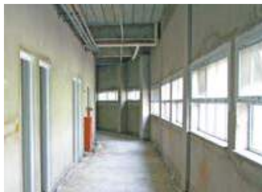
Proteção - Pisos do hospital estão protegidos por uma manta acimentada para impedir riscos no material