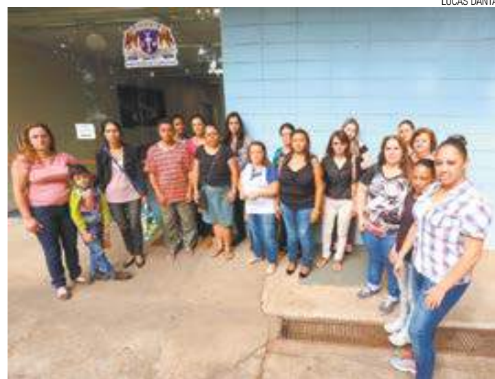
Protesto - Educadores deveriam receber ajuda de custo de R$ 550

Prefeitura não repassou valores às entidades