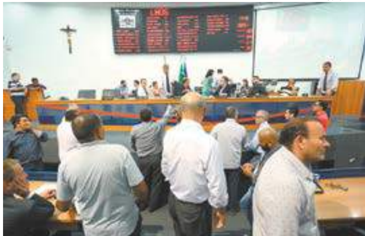
Câmara - Projeto será enviado no próximo ano por falta de tempo hábil

Projeto de lei de cargos deve ser feito até fevereiro