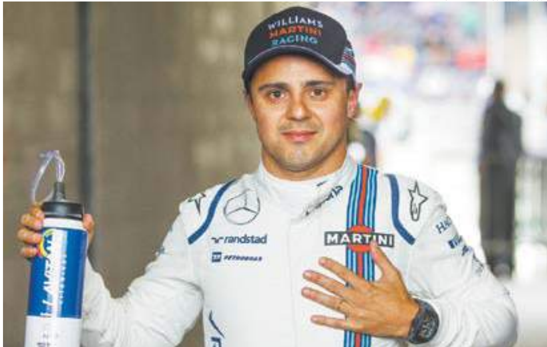
Fênix - Como a ave lendária, Felipe Massa ressurgue das cinzas, assina contrato e só espera anúncio de Bottas

Caso se concretize, será um ótimo negócio para Felipe Massa, que irá retornar à Fórmula 1 em 2017 ganhando 50% a mais do que nesse ano, chegando aos 6 milhões de euros, cerca de R$ 20 milhões.