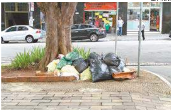
Sujeira - Ruas da cidade ficaram lotadas de lixo na primeira paralisação

A coleta de lixo, desta forma, está novamente suspensa. Da primeira vez em que os lixeiros pararam, a reclamação era de que o salário, que deveria ter caído nas contas até dia