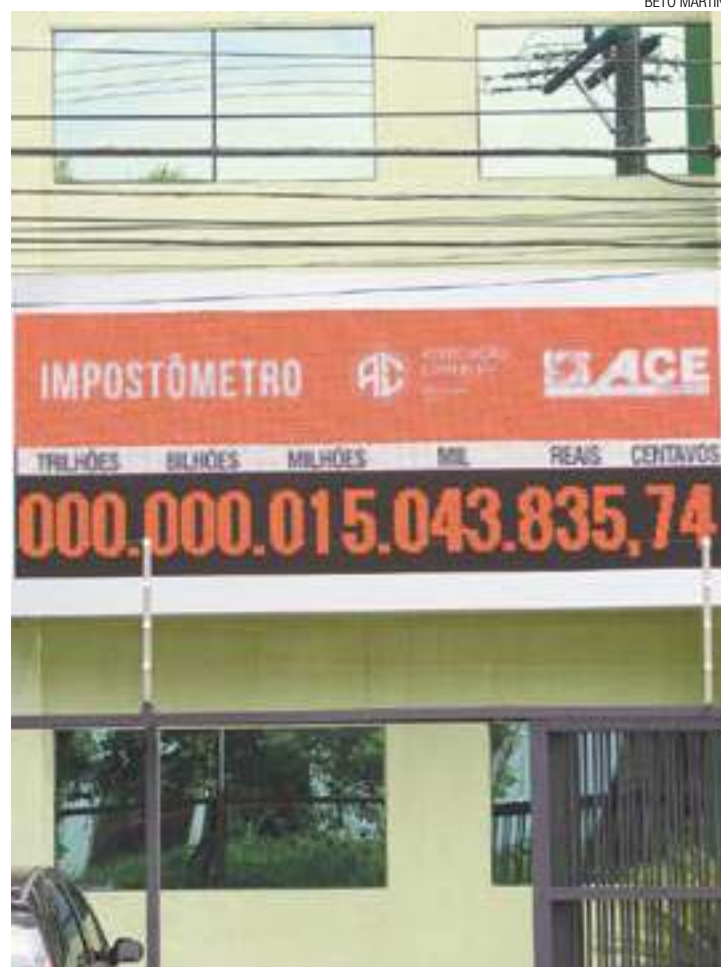
Subindo - Valor mostrado no Impostômetro cresce com o passar do tempo

se que as vendas no Natal realmente decepcionaram. Mas, segundo o especialista, as medidas tomadas pelo Governo Federal podem melhorar o panorama. "Isso vai modernizar a economia brasileira. No fim de 2017, teremos melhores resultados", afirmou.