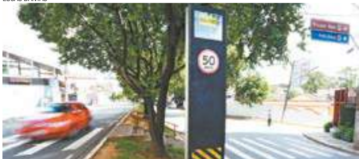
Alerta - Totens no Centro estão sinalizados com a palavra "desligado"