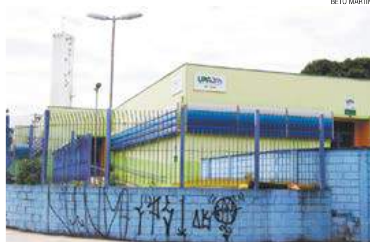
Fechada - Pronta há dois anos, UPA Paulista é alvo até de pichadores

Em maio do ano passado, a Folha Metropolitana mos-