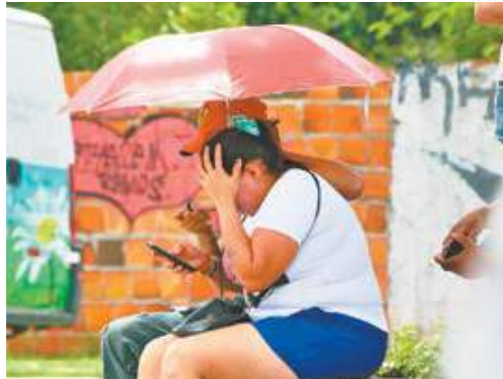
Desespero - Mulher leva a mão à cabeça e chora ao ler algo no celular