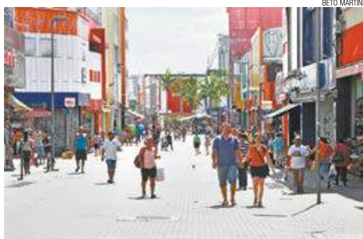
Vazio - Poucos clientes foram às ruas e algumas lojas ficaram fechadas

Consumidores não se empolgaram com as promoções