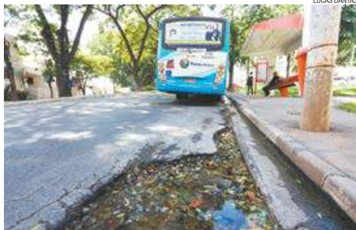
Ponto de ônibus - Trecho de asfalto cedeu e acumula água e folhas