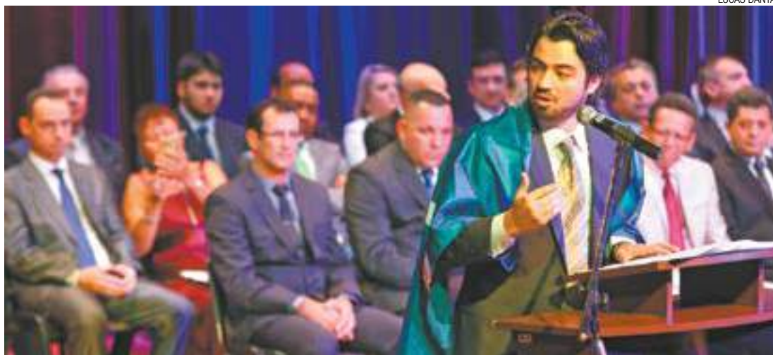
Rombo - Guti ressaltou que o R$ 1,5 bilhão não inclui a dívida da Prefeitura com a Sabesp, estimada em 2,7 bi

4,3 bilhões de reais é o total da dívida municipal