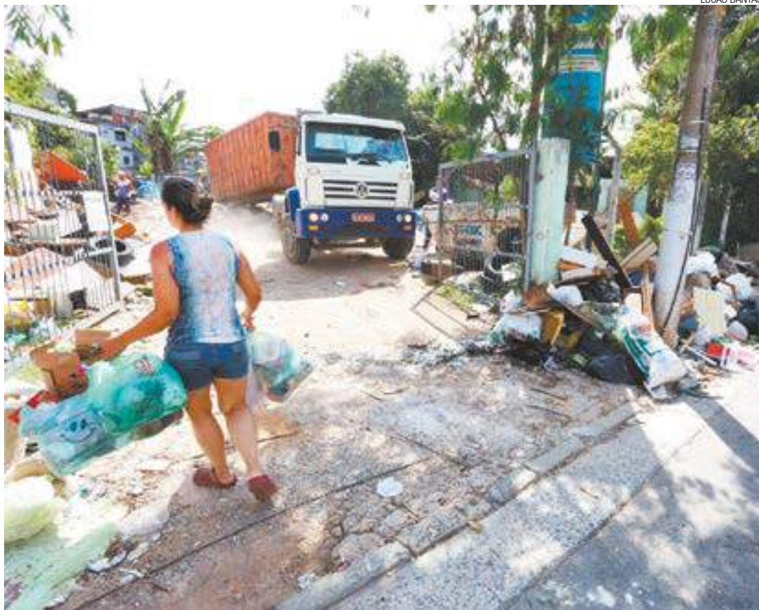
Superlotado - Todos os tipos de dejetos são deixados na calçada; alguns detritos já ocupam parte da rua

A Prefeitura informou que a organização e limpeza dos materiais recebidos e descartados nos PEVS está sendo feita. O acúmulo dentro do PEV foi devido ao aumento de material entregue nos últimos dias. Ainda de acordo com a administração pública, o lixo da calçada é devido ao desrespeito de alguns quanto aos dias e horários de funcionamento.