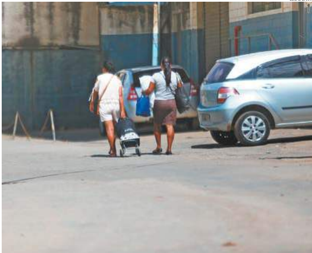
Sem visitas - Parentes tiveram de voltar para casa com os mantimentos após represálias da direção do presídio

A Secretaria da Administração Penitenciária (SAP) não respondeu aos questionamentos da FM.