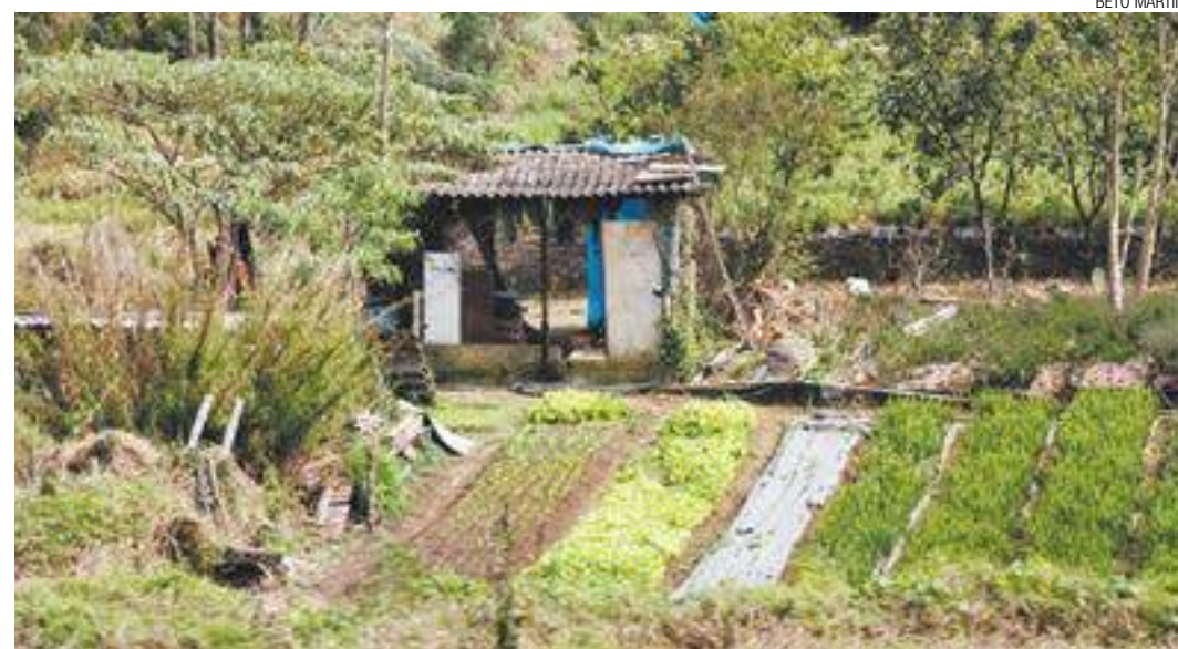
Inflação - O preço dos alimentos nas feiras e supermercados está tão alto que há gente investindo em hortas