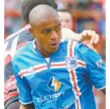
Guarulhense - Welder, que já fez dois gols, nasceu no município

O artilheiro já defendeu o Palmeiras e o Grêmio na base e sonha alto. "Quero um contrato profissional, depois ir para a Europa. Eu quero ser o melhor jogador