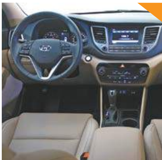
Atraente - Volante e manopla revestidos em couro