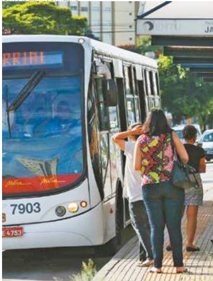
Taxa - Preços foram instituídos pela Empresa Metropolitana de Transportes