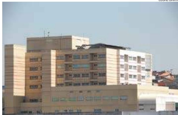
Espera - Mulher está internada no Hospital Pimentas Bonsucesso

Ontem, a mãe chegou a ser levada para a sala de ci-