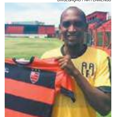
Palito - Chegada ao Flamengo incomodou os torcedores do Marília

reportagem, mas as ligações não foram atendidas. A reportagem também tentou contato com Palito, sem sucesso.