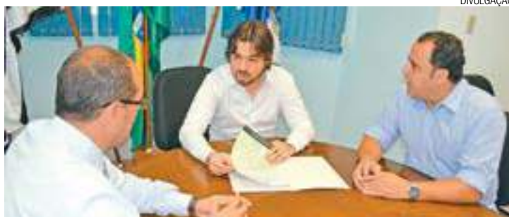
Reunião - Prefeito e vice se reuniram ontem com o presidente da ACE