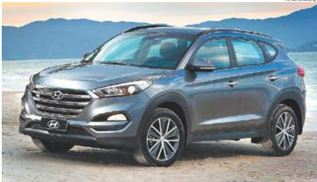
Tecnologia - Novo SUV tem ótimo desempenho, alto índice de eficiência energética e segurança de ponta

Com distância entre-eixos de 2.670 mm e comprimento total de 4.475 mm, o Hyundai New Tucson oferece conforto para os passageiros e muito espaço para bagagem.