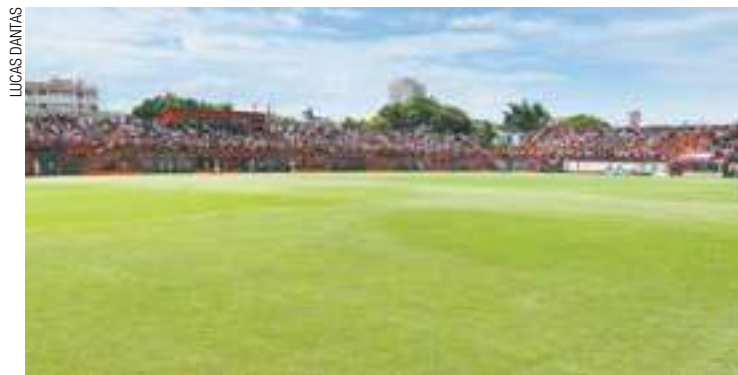
No jeito - Estádio Antônio Soares de Oliveira recebe os jogos do grupo

Os rivais encaram situações distintas na competição. O Índio está mais tranquilo depois da virada e vitória por 2 a 1 contra