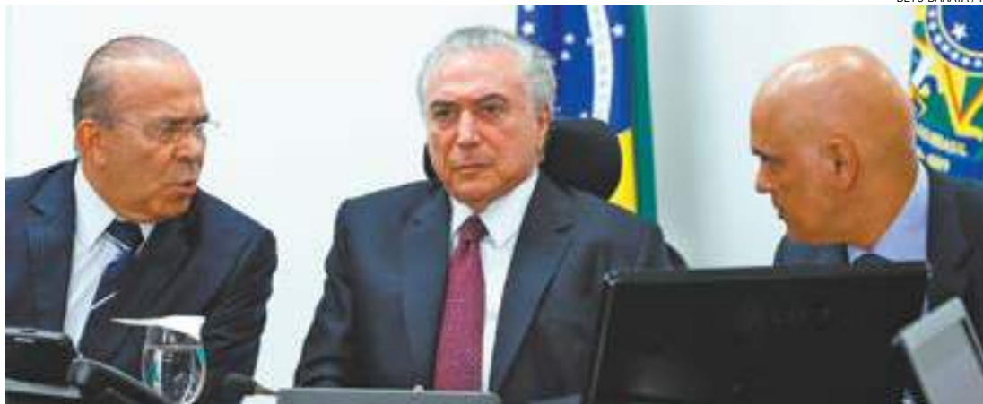
Falou - Após três dias, Temer se pronunciou sobre o massacre no presídio de Manaus: “acidente pavoroso”

Segundo a Secretaria de Comunicação do Estado, os corpos de 46 vítimas já foram identificados. Desses, 18 foram liberados para as famílias das vítimas: 14 deles são de presos do Compaj e quatro de detentos mortos na Unidade Prisional do Puraquequara (UPP), na zona rural de Manaus. Os assassinatos no Puraquequara ocorreram na tarde de segunda-feira, horas após o fim da rebelião no Compaj. A maioria dos corpos já reconhecidos está degolada.