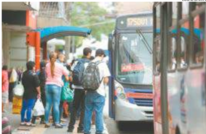
Despesa - Aumento da passagem afeta diretamente a vida dos trabalhadores

Aumento atinge área metropolitana de São Paulo