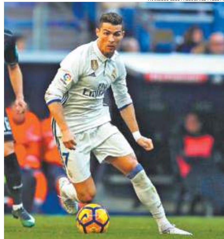
Boa temporada - Português ganhou Eurocopa, Champions e Mundial