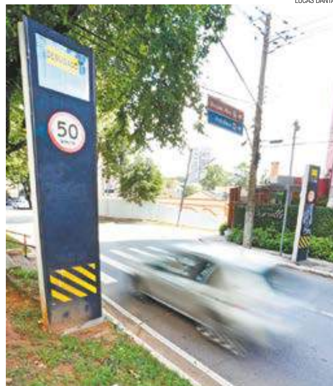
Trânsito - Algumas vias do Centro seguem com radares desligados

De acordo com a STT, a data não foi definida por conta de atrasos nos prazos jurídicos. Apesar da mudança na administração, a pasta não estuda rever os limites de velocidade nas vias.