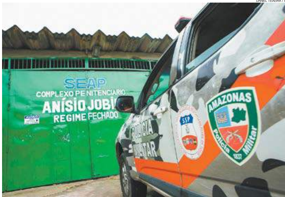
Apreensão - Carro da Polícia Militar de Manaus (Amazonas) aguarda em frente à Penitenciária Anísio Jobim

Um dos vídeos mostra uma fileira de cabeças fora dos corpos em que supostos membros da facção do Norte "prestam contas" a eventuais mandantes, dando os nomes de cada morto decapitado. São mostradas nas imagens cinco cabeças de prováveis membros da facção paulista. "É tudo do comando (de São Paulo)", afirma o operador do celular que bate uma faca na testa de cada cabeça arrancada.