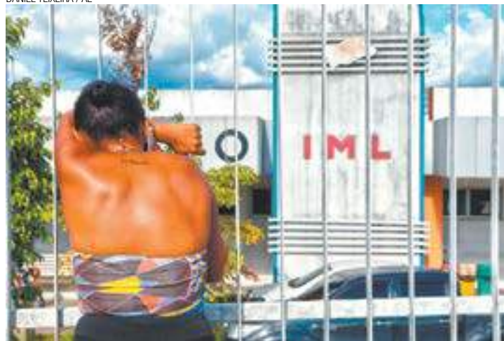
Angústia - Parente de preso chora, desesperada, em frente ao IML

"Como dezenas de funcionários vão dar conta de milhares de presos?"