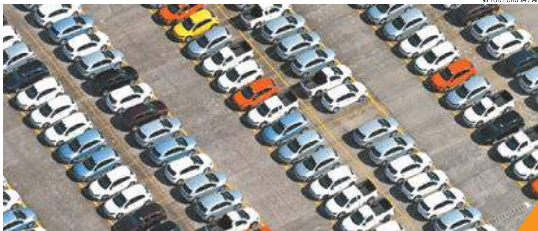
Lotado - Pátio de uma montadora em São Paulo está abarrotado de carros zero quilômetro

“Este foi um dos setores da economia que mais sofreu com as crises econômica e política do País. O mercado retroagiu a volumes equivalentes aos anos de 2005 e 2006. Este resultado deve-se a fatores já comentados ao longo do ano passado, como a queda acentuada do PIB, incertezas geradas pela política, pelo desemprego, baixo índice de confiança do consumidor e de investidores, entre outros”, afirmou Alarico Assumpção Júnior, presidente da Fenabreve, em nota emitida à imprensa.