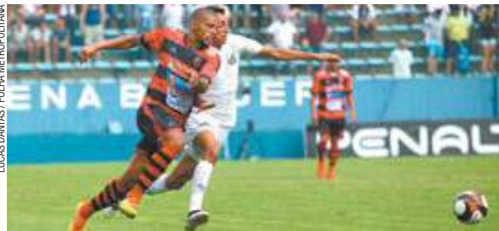
Experiência - Time deixa o torneio com uma vitória e três derrotas