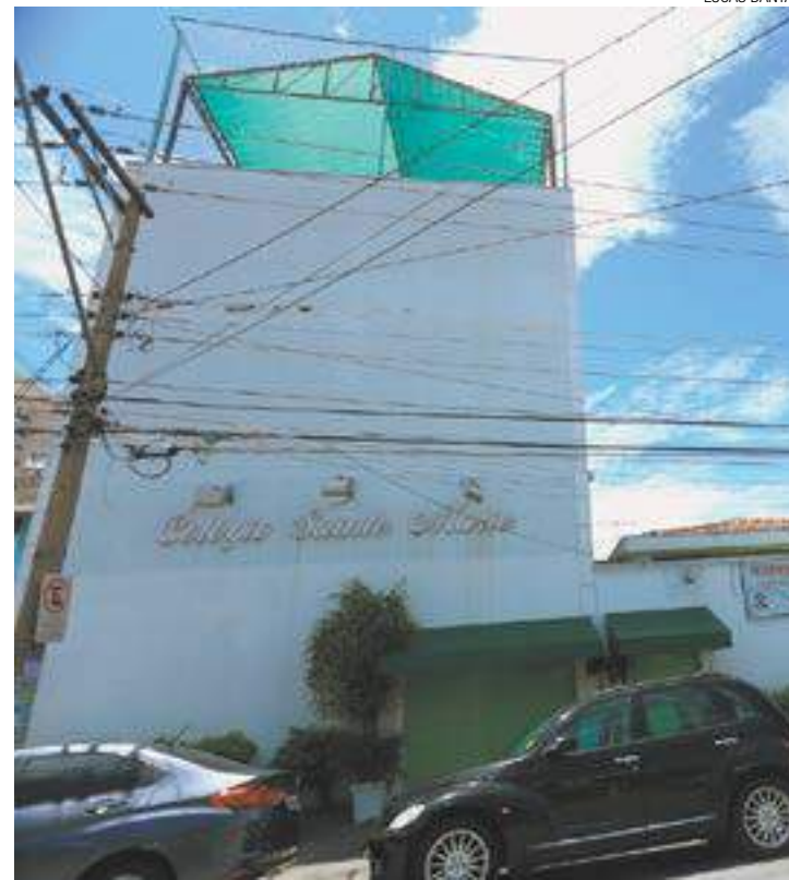
Crise - Sede do Colégio Sainte Marie, na Vila Rosália (Região Vila Galvão)