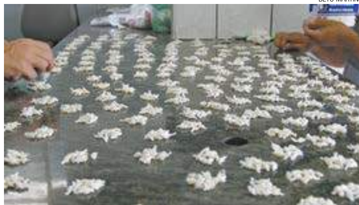
Pesagem - Sete quilos de maconha, 2,4 de cocaína e 1,8 pedras de crack

Segundo informações da PM, os entorpecentes foram encontrados numa casa alugada na Rua São Paulo, no Jardim Ponte Alta (Região Bonsucesso) após abordarem o jovem. Não havia ninguém