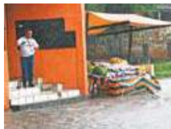
Medo - Comerciante observa a água quase invadindo sua loja