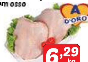
Peito de Frango com osso