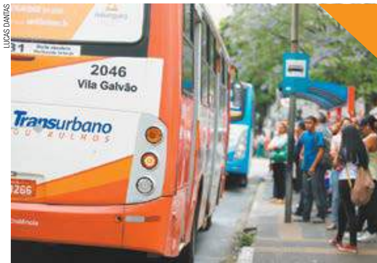
Economia - Reajuste é metade dos 18,4% anunciados pelo ex-prefeito