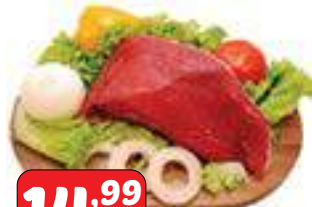
Coxão Duro peça/pedacão/bife