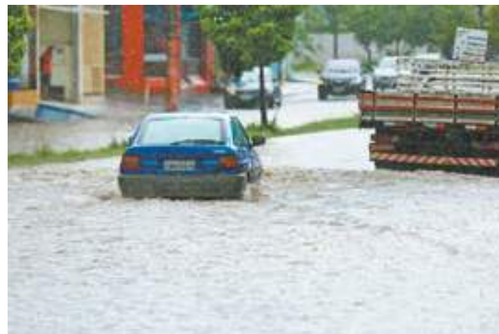
Corajoso - Motorista se arriscou em "rio" formado pela enchente