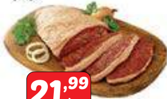
Picanha Fatiada peça