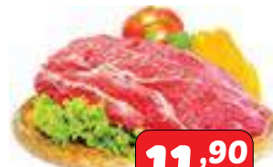
Acém Bovino peça/pedacão