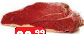
Alcatra com Maminha peça/pedacão/bife

São mais de 25 mil itens para você aproveitar os melhores preços