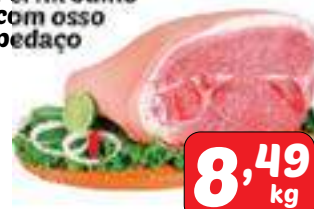
Pernil Suíno com osso pedacão