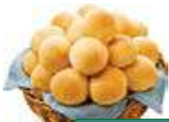
PÃO DE QUEIJO