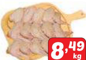
Asa de frango