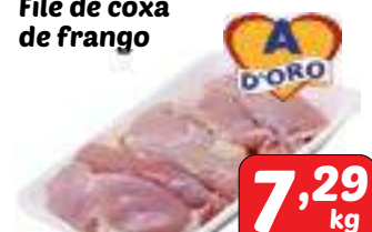
Filé de coxa de frango