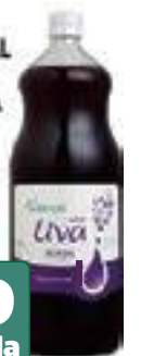
SUCO INTEGRAL DE UVA NOVA ALIANÇA TTO 1L