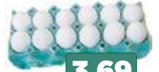
OVOS BRANCOS AJA dúzia