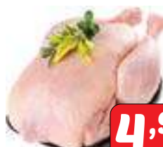
Frango Inteiro resfriado ou congelado