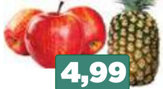
MACÃ RED(KG)/ ABACAXI HAVAI(UN)