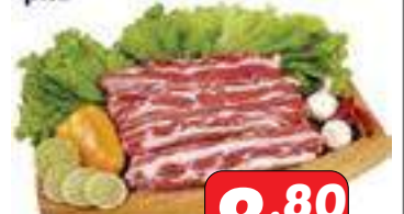
Costela Bovina p.a.