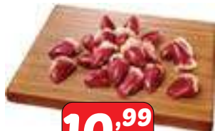
Coração de Frango