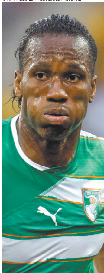
Sonho distante - Drogba tem propostas de outras duas equipes