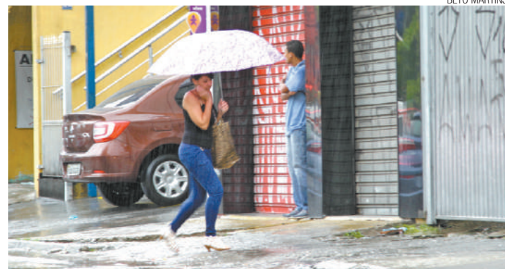
Garoa - A partir da semana que vem, chuvas serão mais leves na cidade