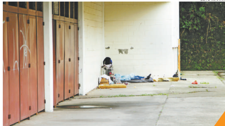
Abandono - Colchões, roupas e objetos são encontrados na entrada

Para inibir as invasões constantes de moradores de rua e de usuários de droga, como relataram os vizinhos, será instalado um posto Grupo de Operações Táticas Especiais (Gote) dentro do ginásio.