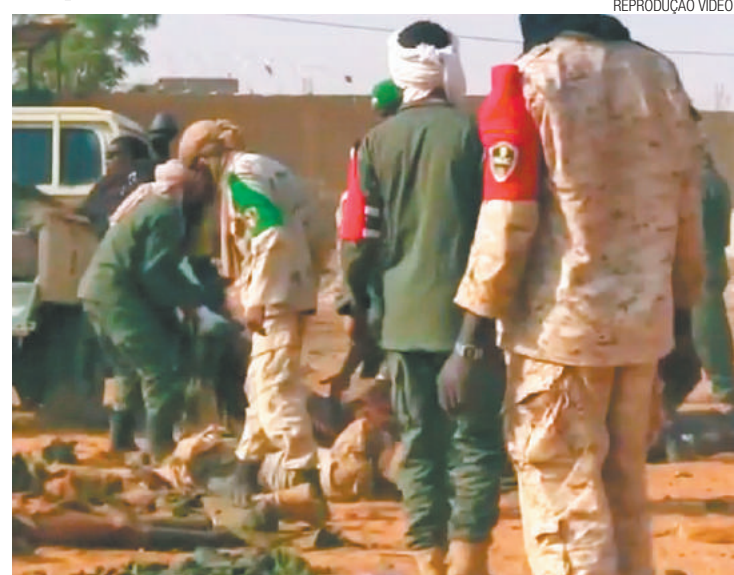
Dor - Homens juntam corpos das pessoas assassinadas em atentado

A região desértica do país africano foi controlada pelo grupo Estado Islâmico em 2012 e recebe aju-