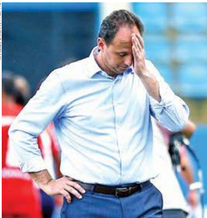
Enxaqueca - Ceni não conseguiu arrumar a defesa do São Paulo no jogo

Não demorou muito para o Audax fazer o primeiro gol, com Marquinho, que aproveitou uma sequência de erros da defesa do São Paulo. O time do Morumbi ainda pensava em esboçar uma reação quando, em uma linda jogada de ataque, a defesa do São Paulo foi envolvida e após dois toques de calcanhar, Pedro Carmona fez o segundo, deixando a pequena torcida quieta na Arena Barueri.