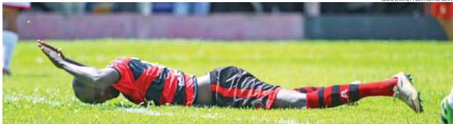
Assim não dá - Jogador do Flamengo cai no chão na partida contra o Noroeste; atletas ficaram decepcionados com outro resultado ruim no torneio

A torcida que compareceu ao Ninho viu o jogo começar bem travado no meio de campo. Até os 25 minutos a partida seguia sem emoções. Foi quando os jogadores do ataque