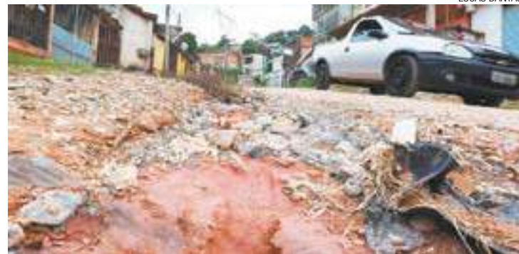
Pedras - Moradores reclamam que é quase impossível trafegar de carro