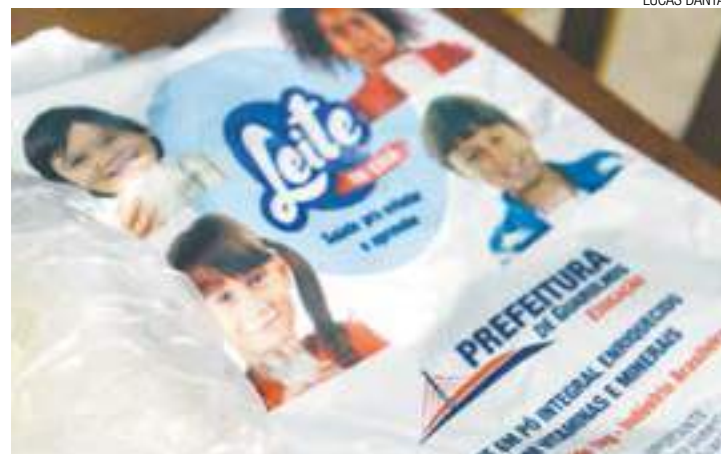
Auxílio - Medida foi implantada ainda no governo Sebastião Almeida (PT)

Custo do leite caiu de R$ 30 milhões a R$ 24 milhões