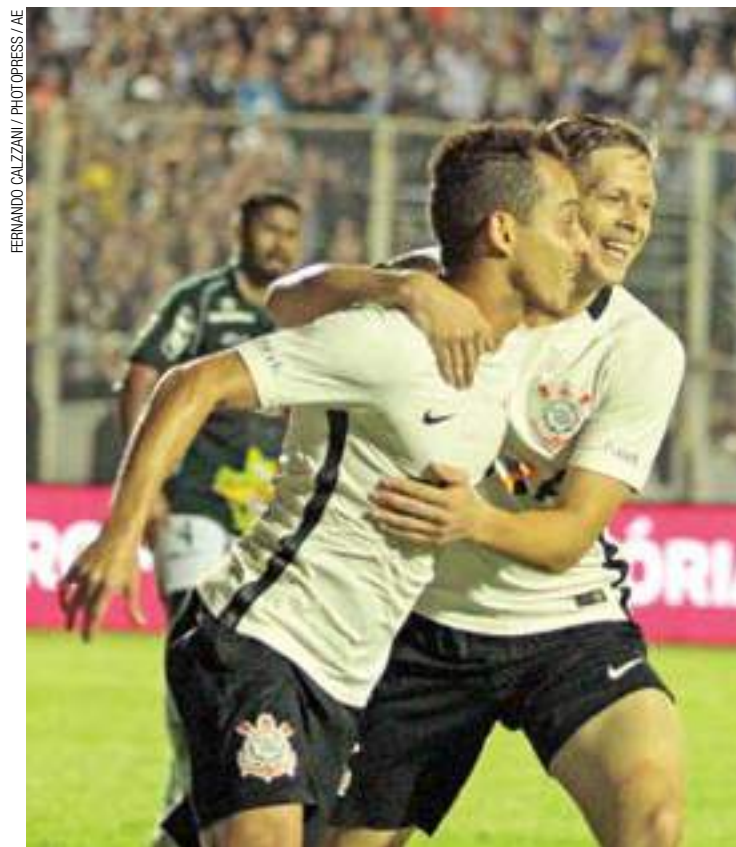
1 a 0 - Apesar do placar magro, Corinthians segue na segunda fase