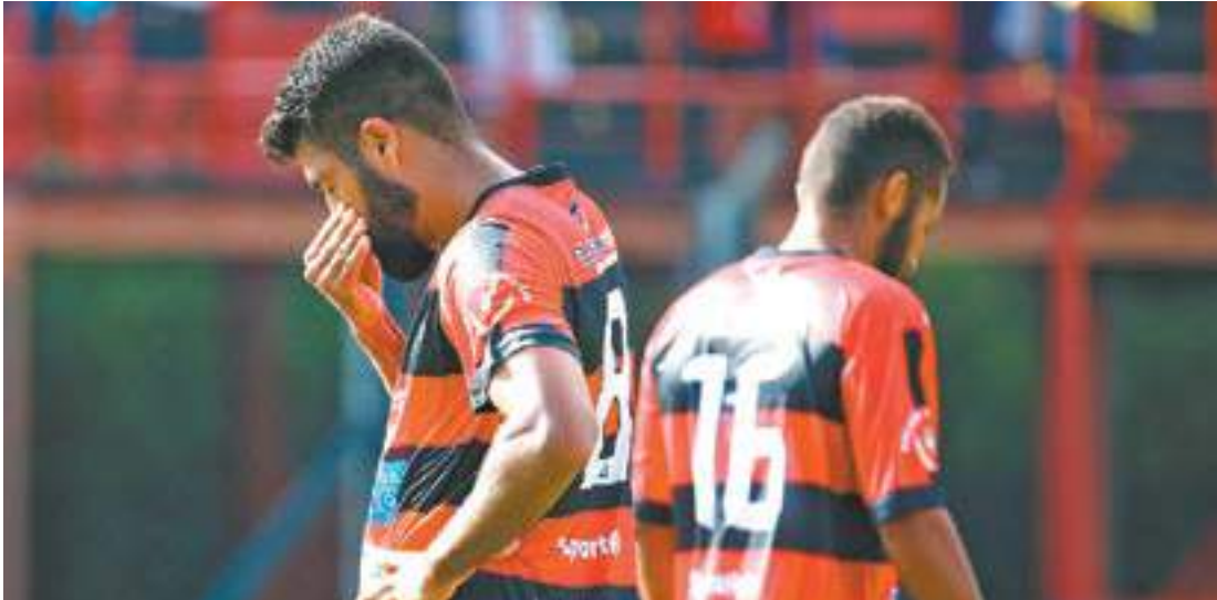
Tristeza - Jogadores do Flamengo lamentaram profundamente a chance perdida de marcar três pontos em casa