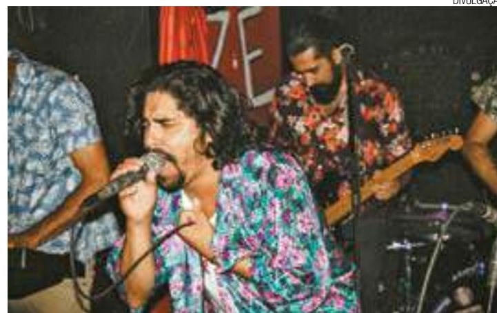
Música - Evento será realizado no Deco Rock Bar, hoje, às 21h