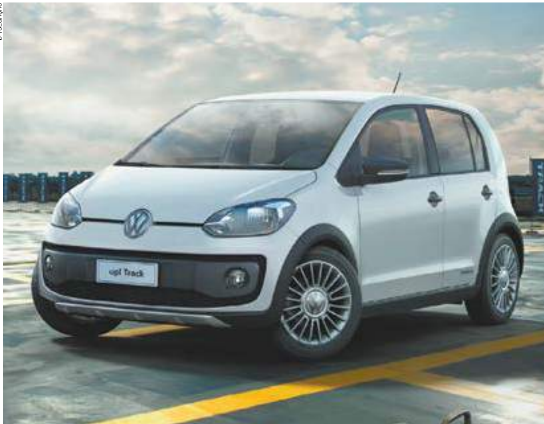
Caprichoso - O Up! Track apresenta apliques sob os para-choques dianteiro e traseiro em chrome effect

Rápido, leve e econômico, o compacto urbano da Volkswagen custa R$ 46.440