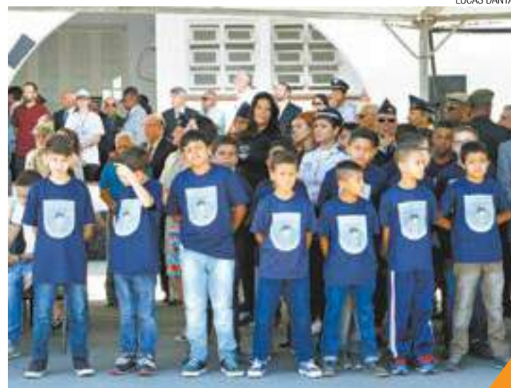
Crianças - Projeto de inserção social oferece atividades esportivas