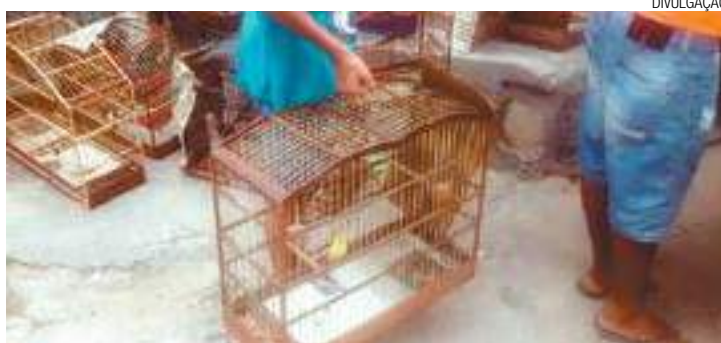
Anônimo - Denúncia de desconhecido levou guardas ao local do cativeiro

A GCM chegou ao local por meio de uma denúncia anônima e encontrou o homem com os animais silvestres presos em diversas gaiolas. Foral salvos 10 picharros, duas coleirinhas,