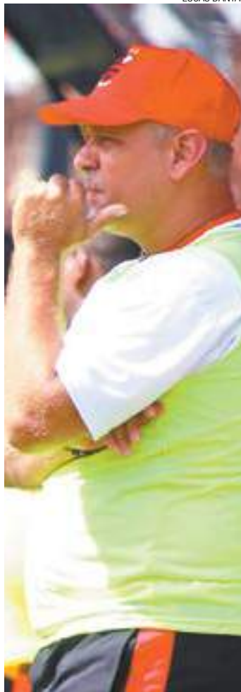
Despedido - Resultados ruins levaram à demissão do técnico

Time enfrenta amanhã, às 16h, o Taboão da Serra