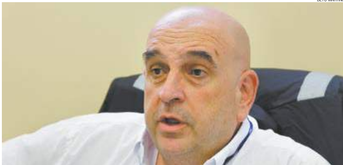
Investimento - Novo gestor disse que dividirá esgoto em lotes para realizar obras e ampliar serviço prestado