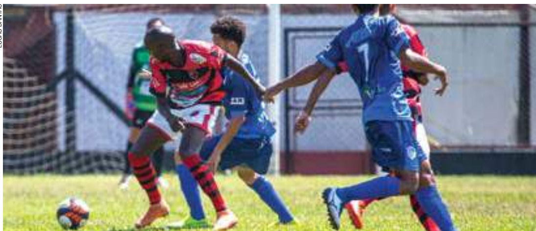
Devendo - Palito (à eq.), trazido por 'chapéu' do Flamengo em cima do Marília, precisa melhorar desempenho