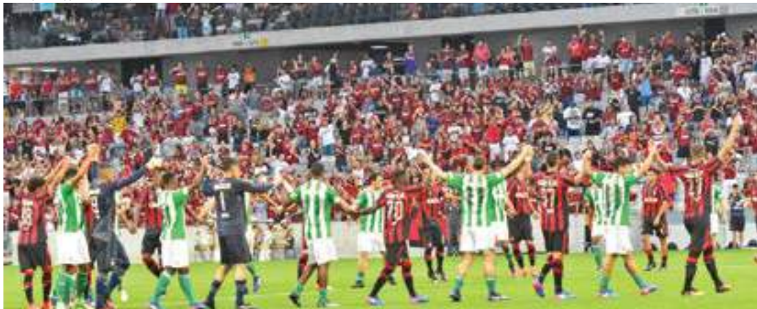
Solidariedade - Torcedores aplaudiram os jogadores, que se deram as mãos para agradecer a presença do público