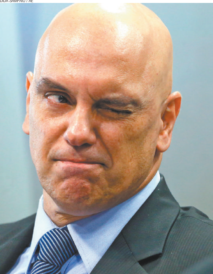
Na boa - Alexandre de Moraes passou por sabatina no Senado Federal