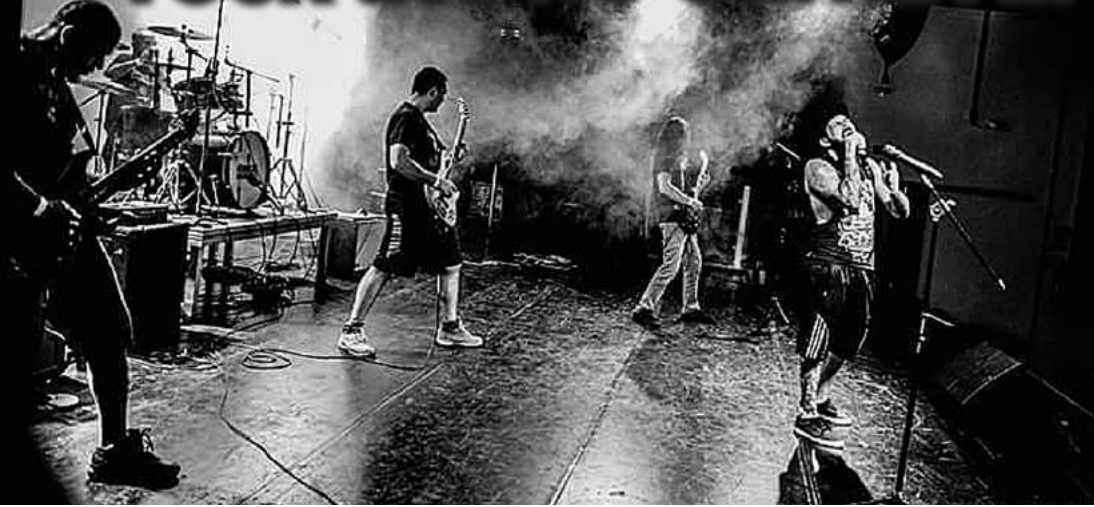
Rock'n'roll - Primeiro Carnarock traz nove bandas independentes da cidade, entre elas o Resistência Terminal

DA REDAÇÃO - O Carnaval é um evento típico do calendário brasileiro, mas nem todo mundo se sente à vontade com os eventos tradicionais e, pensando nisso, a Associação Cultural Rock Guarulhos (ACRG) conseguiu, junto à Prefeitura de Guarulhos e patrocinadores, realizar o primeiro CarnaRock da cidade, na Rua Dom Pedro II, Centro, a partir das 13h, no sábado, 25 de fevereiro.