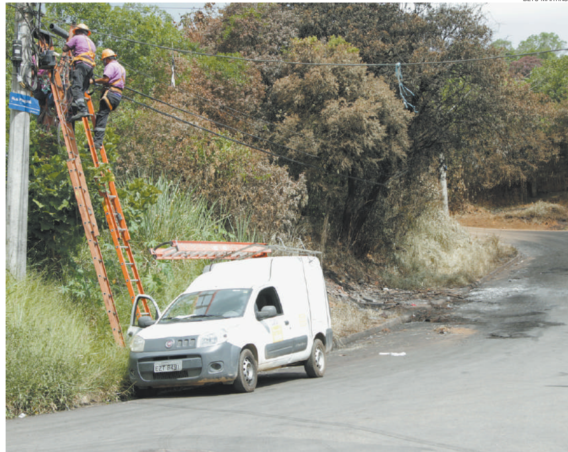
Conserto - Ontem equipe arrumava os fios destruídos no incêndio; sujeira do fogo ainda continua na Rua Paquitá

A Secretaria Estadual de Educação disse que os alunos não foram à aula na segunda-feira. Já a Secretaria Municipal de Educação não respondeu ao jornal até a conclusão desta edição.