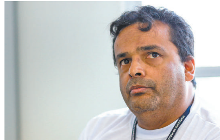
Parceria - Adjunto de Cultura quer parceria com associações e empresas