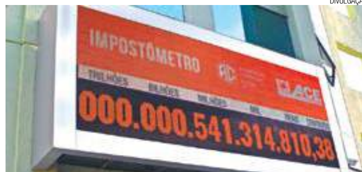
Dois meses - Valor representa o total de impostos pagos pela população

No ano passado, no mesmo dia, foram R$ 548 mi