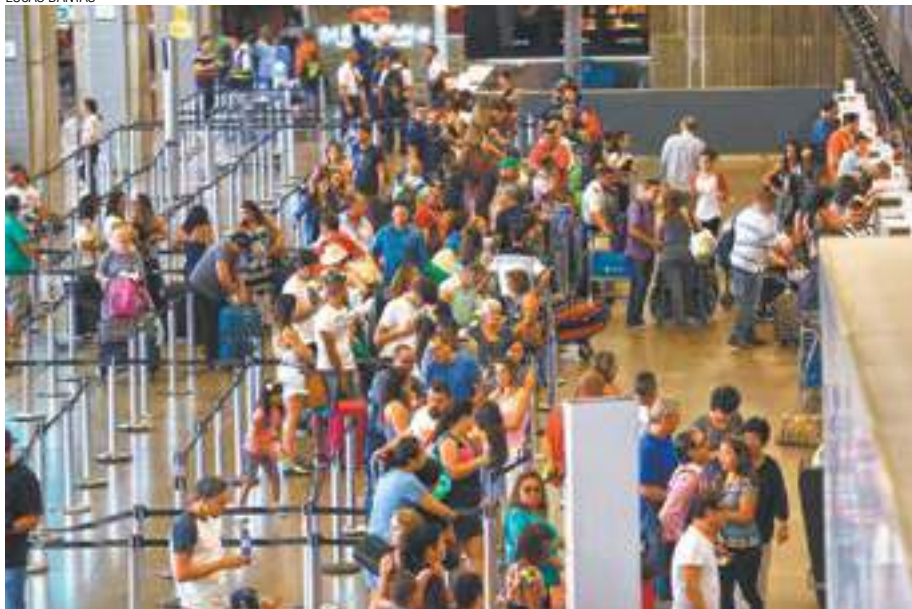
Aviação - Aeroporto de Cumbica deixa de ser o mais utilizado da América Latina