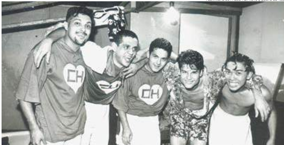
Saudades - Irreverente banda guarulhense ainda é lembrada, com nostalgia, por fãs do Brasil inteiro