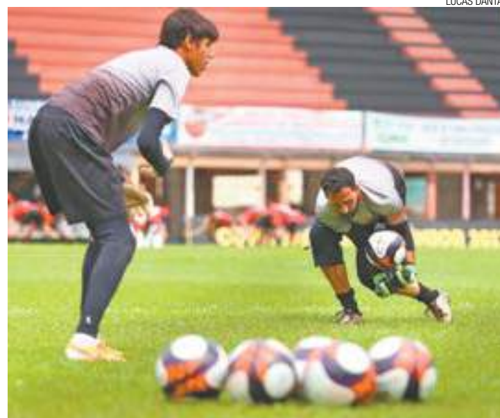
ídolo - “Vamos conseguir fugir (do rebaixamento)”, disse o arqueiro (à dir)

A última partida da equipe foi na sexta-feira, 24, contra a Portuguesa Santista. Os guarulhenses perderam por 3 a 0 e agora estão a cinco pontos do São José, primeiro time fora da zona. Na sequência do Paulista, a equipe enfrenta a Internacional de Limeira na quarta-feira, 8. Os rivais estão na liderança do torneio e ainda não foram derrotados.