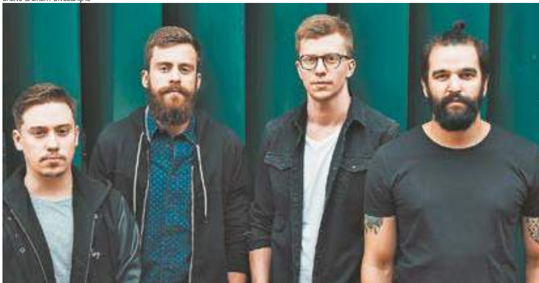
Banda Scalene - Show será realizado no Rancho Sertanejo, à Avenida Guarulhos, 2.212, no Itapegica