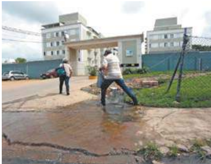
Problema - Líquido fedido jorra constantemente e de maneira intensa

Os moradores e pedestres sofrem para desviar do esgoto pulando por cima do líquido ou pisando nele. Os passageiros do ponto de ônibus também reclamam do problema, já que o esgoto passa pelo local. “Fico com medo de ser atingida pela água”, disse a