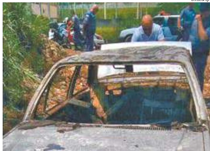
Crime - Dois corpos estavam no porta-malas e outro no banco traseiro