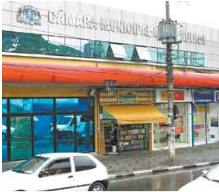
Improdutiva - Leis inconstitucionais não produzem efeitos na cidade

Na comparação com 2015, Guarulhos subiu duas posições. Em 2014, os vereadores guarulhenses chegaram a ser os vice-campeões em criar leis que possuíam, entre outras irregularidades, o vício de iniciativa, que consiste em invadir competências do Executivo Municipal.