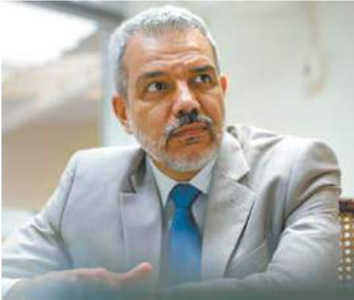
Fiscalização - Calil disse que OAB quer trazer transparência à população