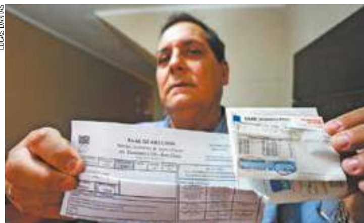
Susto - Cobrança subiu de R$ 84 para R$ 170 em apenas dois meses