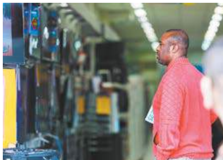
Raro - Crise "afugentou" consumidor das lojas e gerou mais demissões

Indústria começa a se recuperar de seguidas quedas