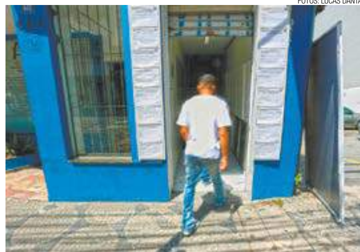
Comum - Trabalhador procura empregos em agências para ter renda

Durante 12 meses, Guarulhos já cortou 12,7 mil postos de trabalho e teve uma variação negativa de 3,93% no estoque de emprego. Em números brutos, a indústria de transformação foi a que mais sofreu neste período: foram 4,5 mil desligamentos a mais do que admissões. O comércio foi o que mais demitiu, no entanto. Foram 50 mil desligamentos e 46 mil contratações nesse setor.