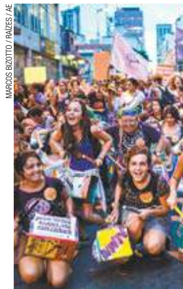
Posição - Marcha reuniu milhares de mulheres no ano passado

O Sinpeem, que representa professores da rede municipal de São Paulo, faz sua assembleia na Praça Oswaldo Cruz, também, na Avenida Paulista, às 14h. Além de se posicionarem contra a Reforma da Previdência e Trabalhista, o ato também reforça a pauta da categoria, que exige do prefeito João Doria (PSDB) o cumprimento de reajuste já aprovados em lei e melhorias nas condições de trabalho, como a diminuição no número de alunos por sala.