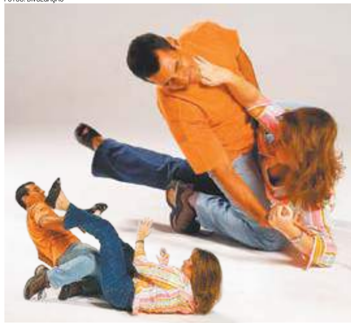
Técnica - Mulheres podem usar técnicas para se proteger da violência