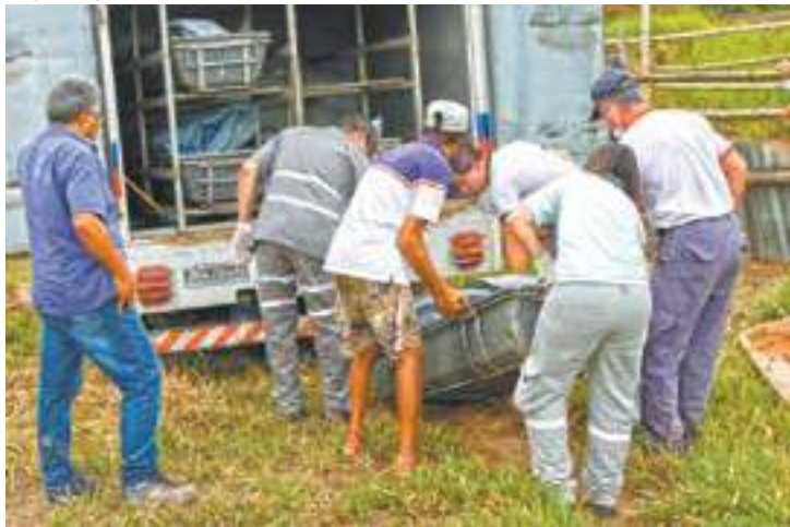
Perícia - Funcionários do IML e bombeiros colocam os corpos no "rabeção"