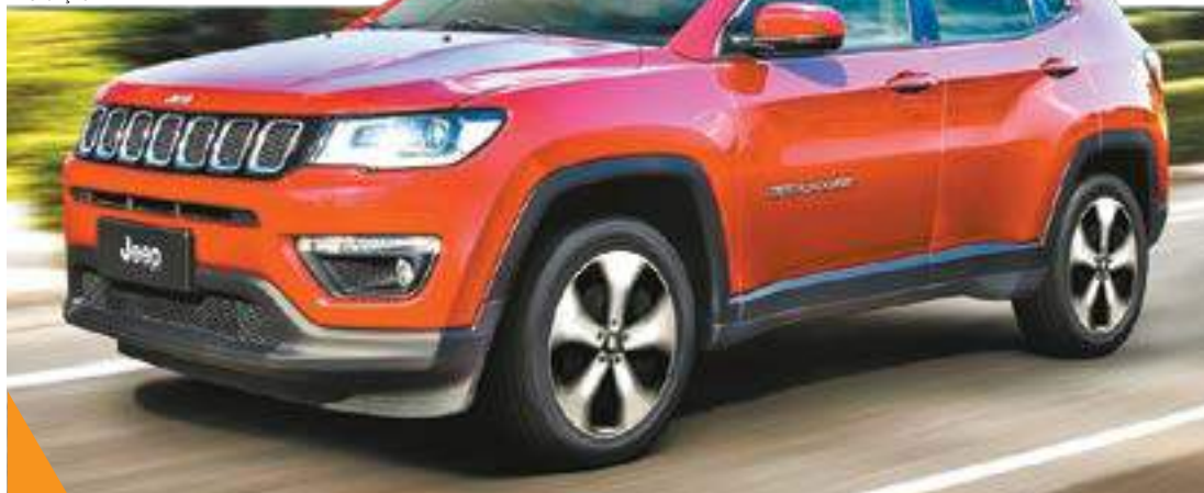
Detalhes - Jeep Compass apresenta um traço típico da marca: a tradicional grade de sete fendas