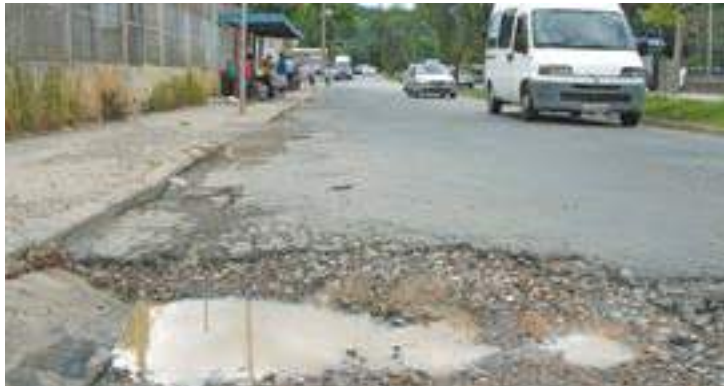
Ponto de ônibus - Problema fica na altura do número 3520 da Faria Lima