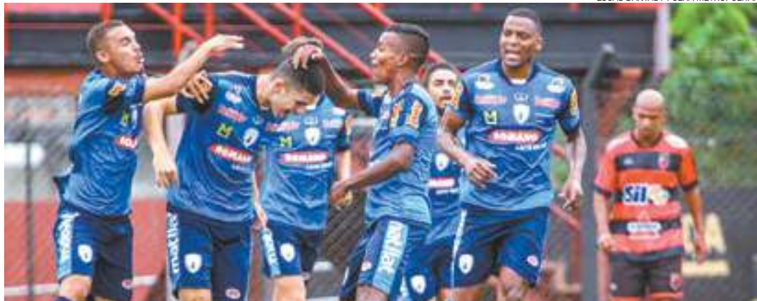
Ruim - Atletas do Catanduvense comemoram empate com o Corvo, ontem, no Estádio Antônio Soares de Oliveira