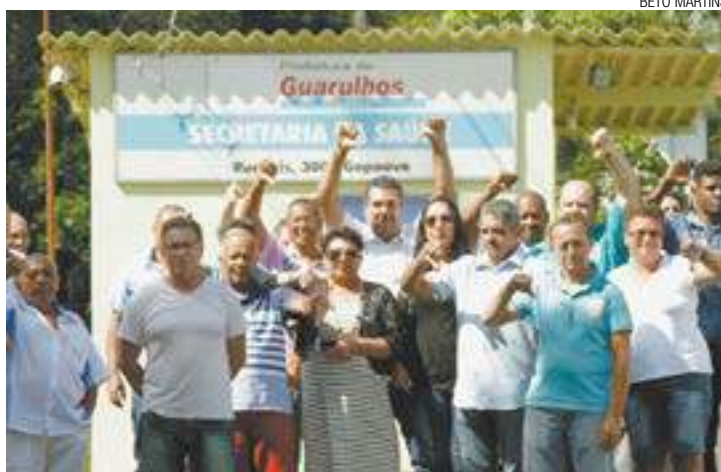
Protesto - Trabalhadores foram até a frente da Secretaria para reclamar

Ao menos trinta trabalhadores foram até o prédio onde funciona a Saúde, na Rua Íris, e protestaram com os veículos estacionados. São duas empresas: a Vancel e a Mendes e Freitas. A reportagem tentou contato com elas, mas não obteve retorno até o fechamento desta edição.