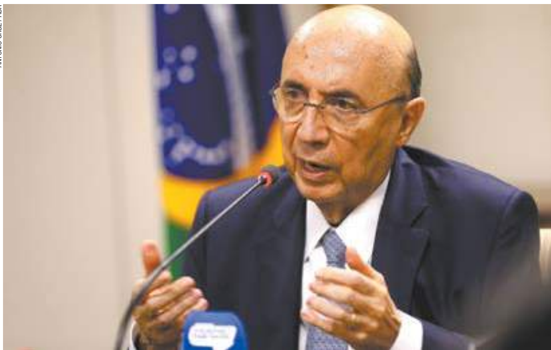
Fazenda - Meirelles destacou que o governo decidiu “não fazer simplesmente um aumento de impostos e tributos”