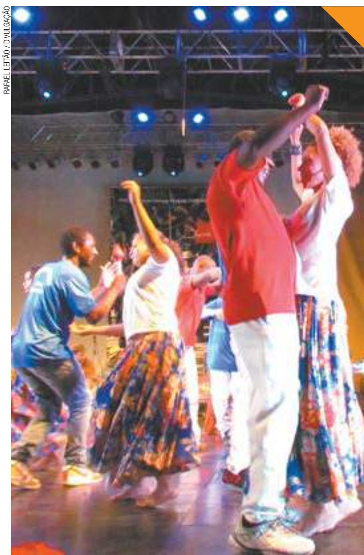
Cultura - A Umbigada é uma dança afro-brasileira criada nos quilombos

grantes, o grupo persiste em manter a essência da música e do folclore de raiz. O grupo reafirma a identidade da origem caipira, numa luta constante contra os estereótipos e as leituras não autênticas.