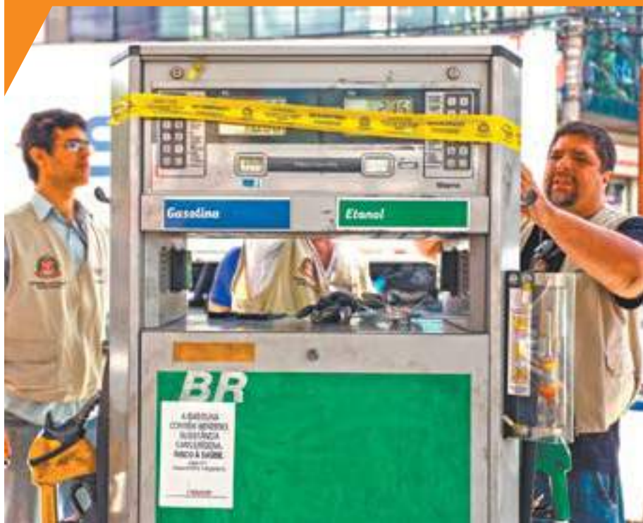
Irregularidades - Dos três estabelecimentos vistoriados, ontem, dois apresentaram problemas