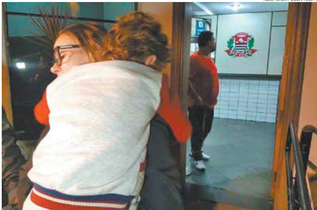
Final feliz - Ainda abalada, mãe sai da delegacia com o filho de seis anos nos braços; um adolescente foi apreendido

Ontem o garoto não foi para a escola e ficou em casa com a mãe, que faltou no trabalho, e com o avô.