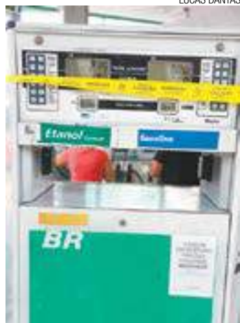
Lacração - Bomba do Auto Posto Maluli, na Avenida Esperança

Seis bombas, das oito disponíveis, no Auto Posto Alegre, na Av. Doutor Renato de Andrade Maia, 2.021, foram lacradas. Em todas as bombas foram instalados chipes, que