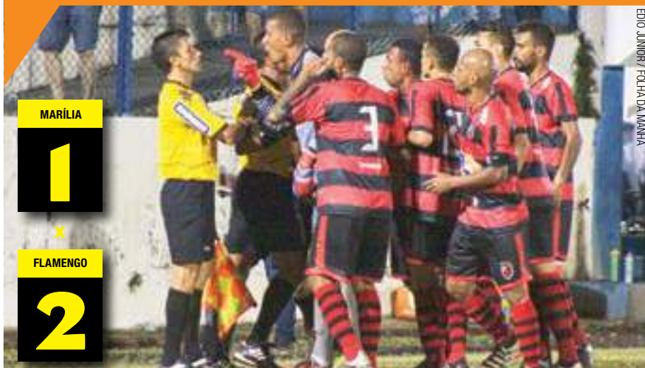
EDIO JUNIOR / FOLHA DA MANHÃ