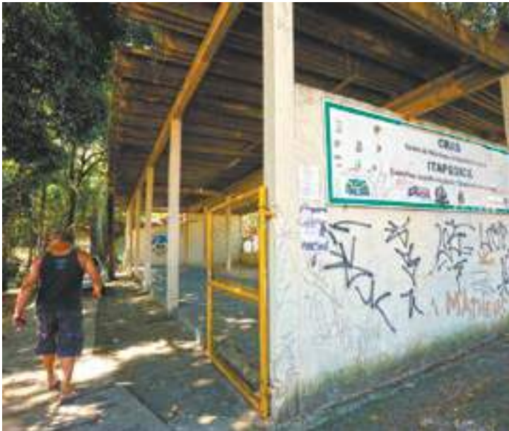
Insatisfação - Usuário deixa o Cras sem conseguir ser atendido