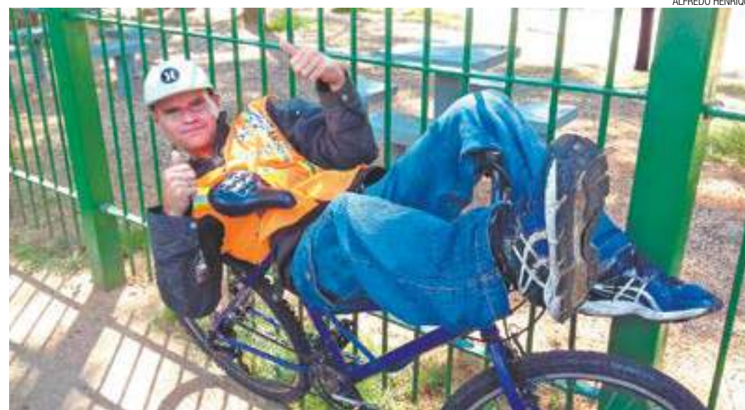
De bem com a vida - Sem um local melhor, trabalhador utiliza sua bicicleta para tirar um merecido descanso