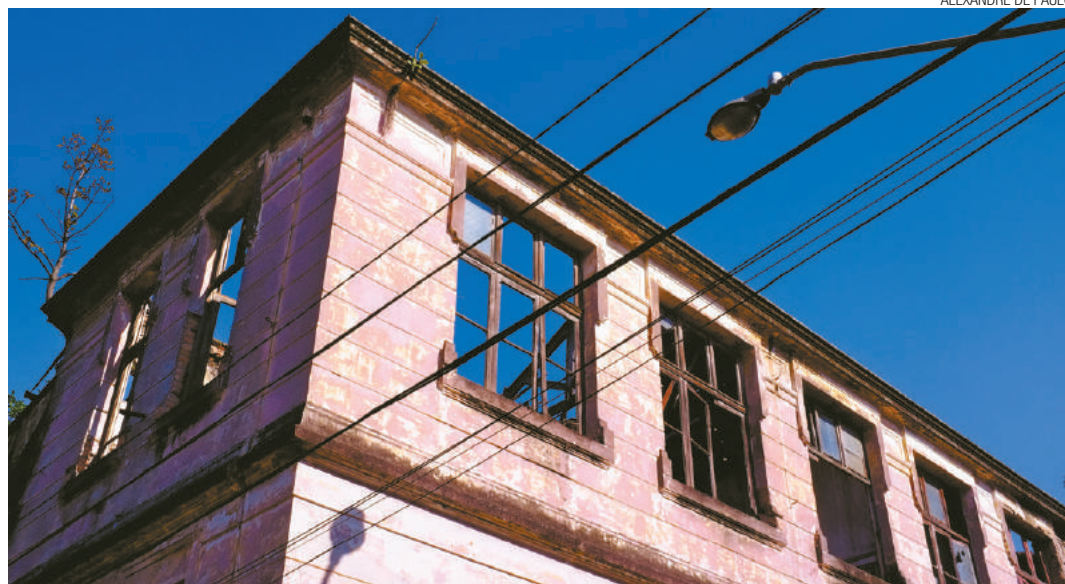
ALEXANDRE DE PAULO

Vila Maria Zélia - Local tem mais de um século e abrigava mais de 2,5 mil pessoas; é um ícone de São Paulo