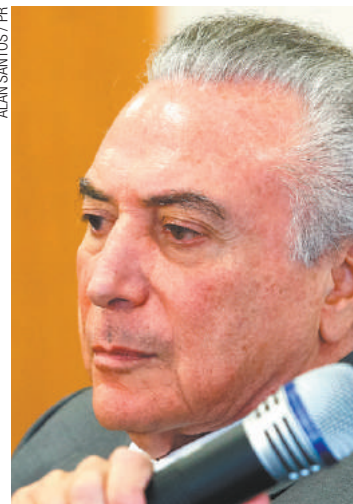
Recuo - Temer sabe que enfrenta dificuldades fortes no Congresso