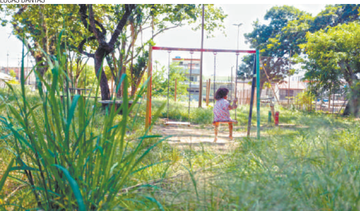
Isolada - Menina brinca no balanço em praça tomada por mato e lixo