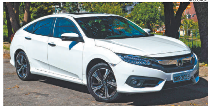
Exótico - Design externo lembra os carros futuristas de filme de ficção

No pé, o resultado aparece a todo momento. No uso urbano, responde bem em baixas rotações, acionando o turbo, nas pequenas arrancadas possíveis, seja em trocas de faixas ou saídas rápidas. Quando vai para a estrada, sensação de prazer e desempenho perfeito. Nas poucas situações em que foi possível acelerar um pouco mais, em condições de teste, extrema facilidade para atingir velocidades mais altas. O câmbio CVT é quase imperceptível, com trocas precisas mais do que suaves.