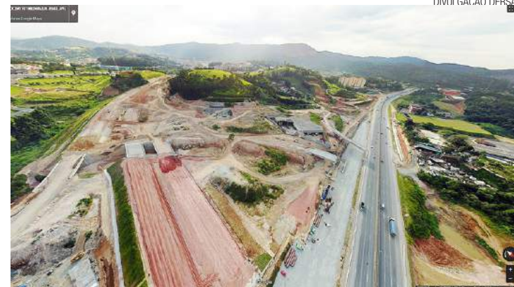
Fernão Dias - Trecho da obra no limite de Guarulhos (à dir.) com São Paulo

Confira as imagens em http://dersa.sp.gov.br/empreendimentos/rodoanel-norte/#fotos .