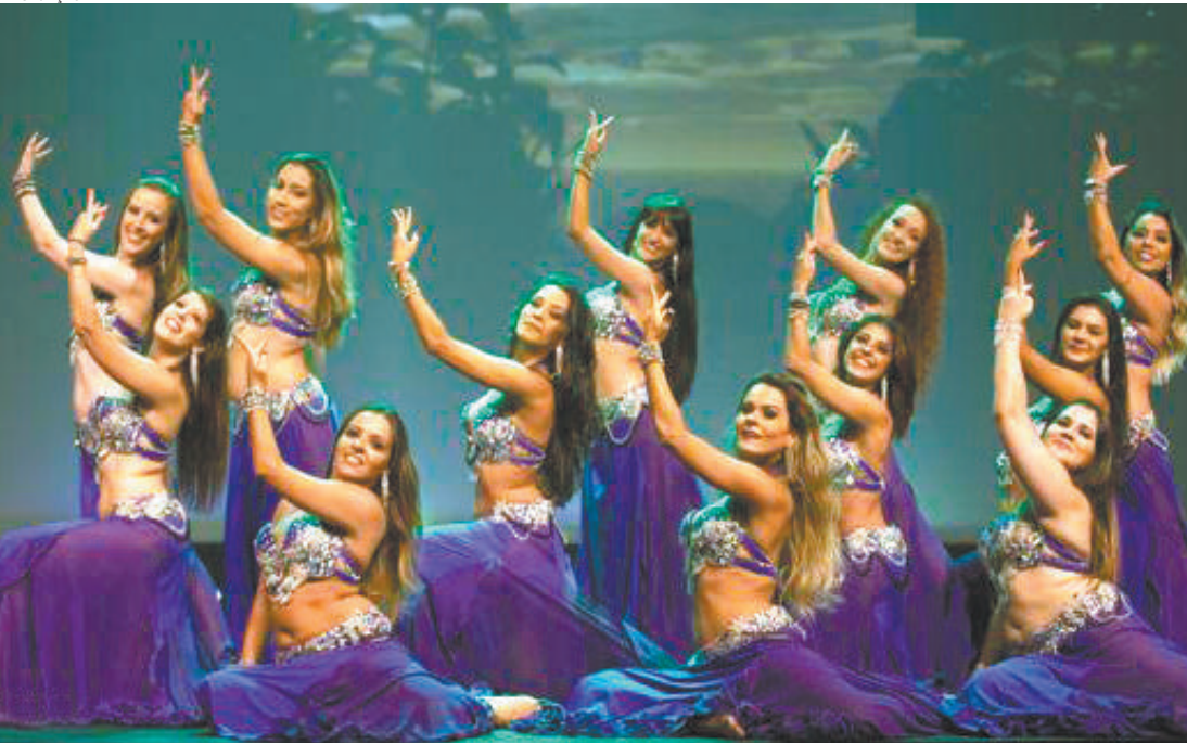
Shows - Festival terá mais de 500 apresentações de danças árabes e orientais, em quatro palcos diferentes