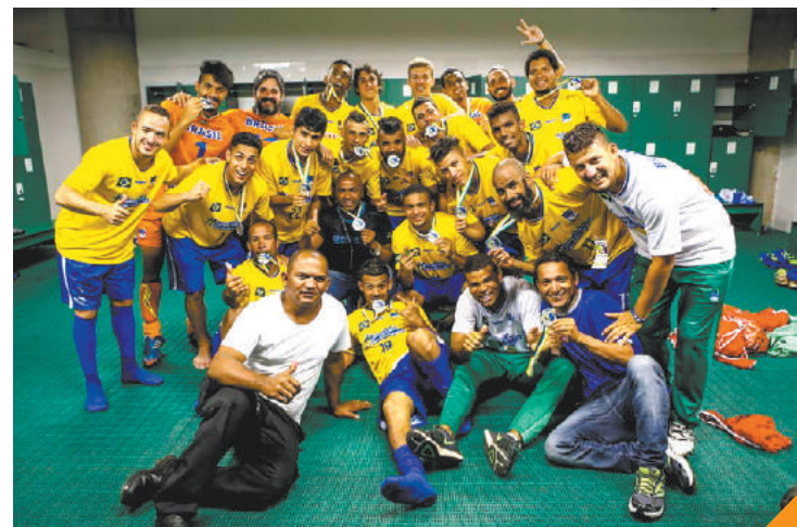
Campeões - Brasil conseguiu vaga na Surdolimpíada pelo Pan

Confederação quer R$ 2,9 milhões do Governo Federal