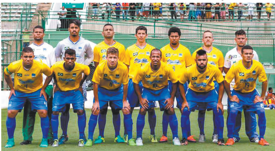
Esquadrão ameaçado - Dentro de campo, equipe é eficiente; dificuldade agora é ter verba para disputar torneio