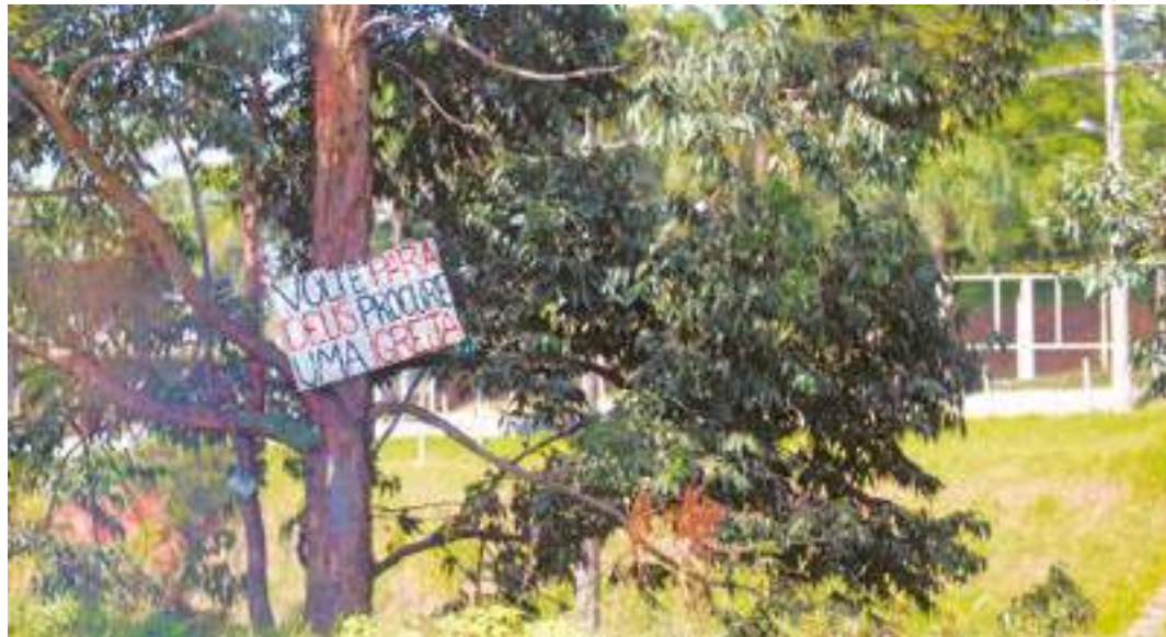
Chamamento - Placa com os dizeres "volte para Deus, procure uma igreja", faz apelo religioso fixado na árvore