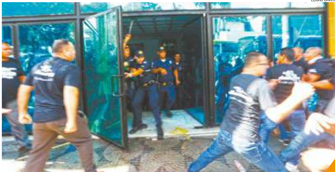
Reação - Sindicalistas forçaram a entrada quando GCMs tentavam fechar a porta do Legislativo