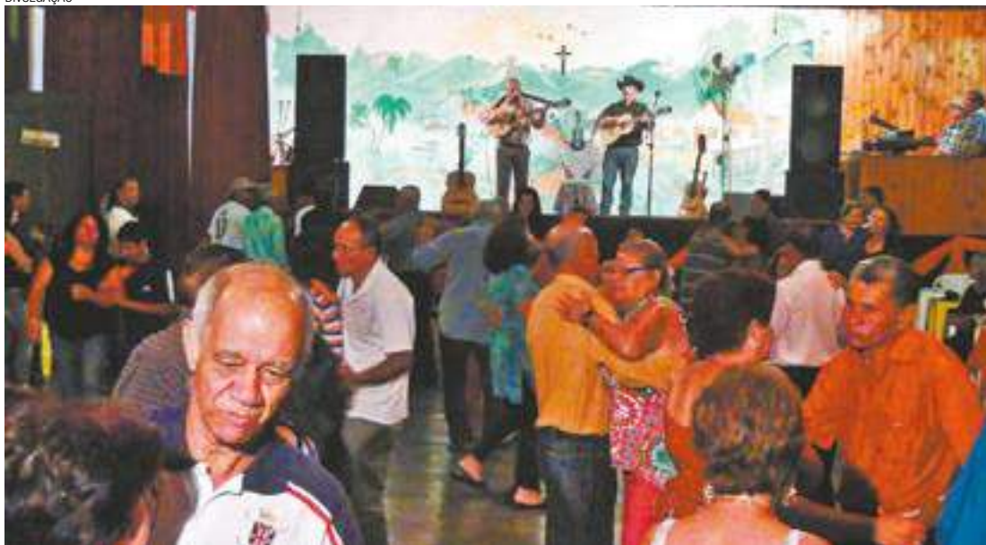
Dança - Música sertaneja é considerada patrimônio cultural; casais lotam o salão com show ao vivo