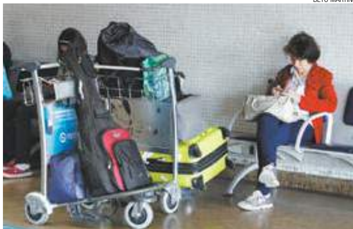
Preocupação - Passageiros devem tomar cuidado com suas bagagens

Ocorrem mais de três furtos por dia só no aeroporto