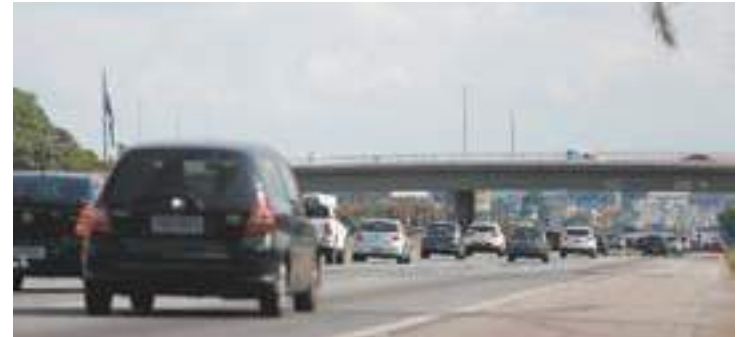
Trânsito - Movimento na Via Dutra ontem à tarde era bastante tranquilo

A Ecovias, concessionária do SAI, não precisou implantar a Operação Subida (2x8), como estava previsto para as 9h de ontem. A descida continuava sendo feita pelas pistas sul das rodovias Anchieta e Imigrantes. Já a subida, pelas