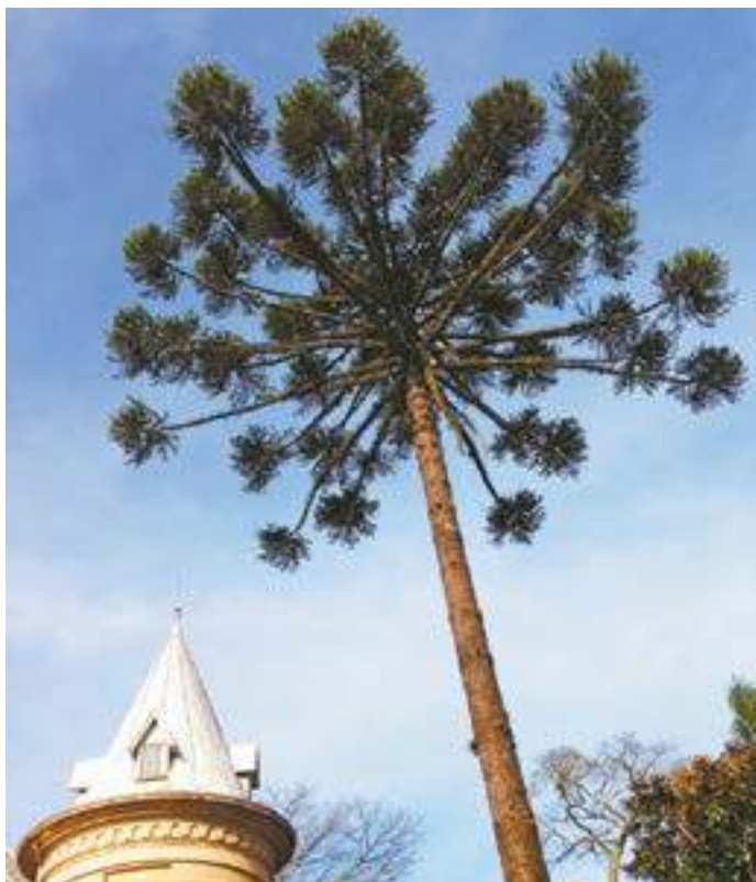
Símbolo - Araucária; nome da cidade significa "terra dos pinhais"