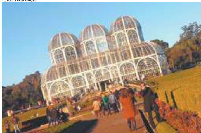
Jardim Botânico - Formato geométrico lembra a bandeira de Curitiba