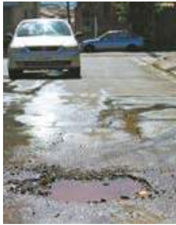
Perigo - Buraco com água acumulada 'engana' motoristas

O motorista ligou para o Serviço Autônomo de Água e