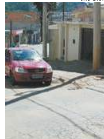
Insatisfação - Moradores dizem que o Saae não retornou ao local

Além do buraco, há um trecho rachado onde há pedaços de asfalto expostos.