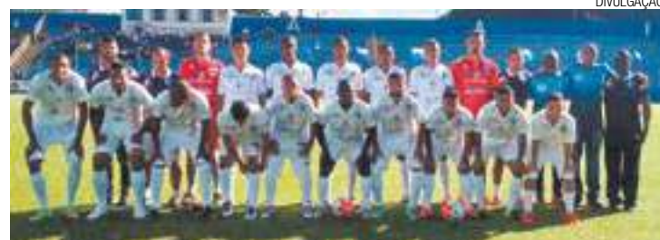
Índio reage - Time foi a Itararé e voltou com três pontos na bagagem

A equipe agora ocupa a 6ª colocação, de oito participantes do grupo, com quatro pontos. Acima dela estão Primavera (4), Osasco (6), Itararé (7), EC São Bernardo (9) e Elosport (9). Classificam-se quatro times para a próxima fase. O próximo jogo é contra o Diadema no sábado, 6, às 15h, no Estádio Antônio Soares de Oliveira.