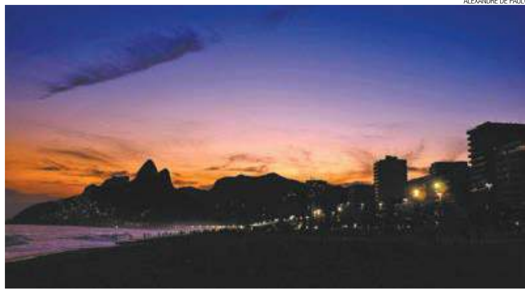
ALEXANDRE DE PAULO

Espectáculo - O "astro rei" se esconde, num dos pores-do-sol mais famosos do Brasil, na praia de Ipanema (RJ)