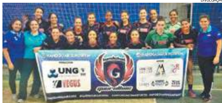
Comemoração - Garotas venceram o São José na estreia da competição

Se o handebol feminino da cidade já gera esperança de uma campanha histórica – o