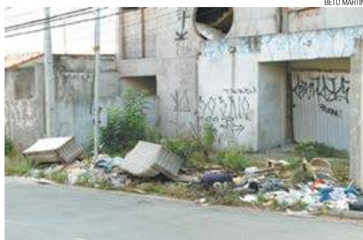
Falta de educação - Pessoas jogam entulho na calçada do imóvel

O Saae informou que verificará o problema hoje e "tomará as providências necessárias."