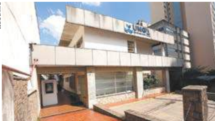
Inscrições - Clínica de Psicologia fica dentro do Campus Centro na UNG

Durante as sessões, que têm início em 15 de maio, serão trabalhados conteúdos que geram tensões emocionais trazidos por esses jovens. Os atendimentos são realizados por profissionais formados, com auxílio dos alunos do curso de psicologia da UNG. Ao todo são oferecidas 36 vagas para jovens com sintomas ou queixas depressivas. Em casos mais graves, os pacientes serão encaminhados para atendimento psiquiátrico e/ou psicológico na