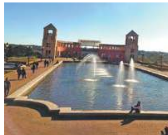
Tranquilidade - Cidade deve ser apreciada sem pressa

Dursk: Av. Jaime Reis, 254 - São Francisco, Telefone: (41) 98855-5383 - www.durski.com.br