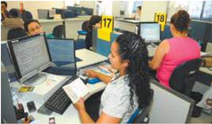
Serviços - Emissão de carteira profissional, PIS e apoio ao empreendedor