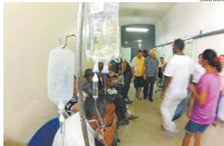
Desafio - Saúde tem dívida de R$ 74 milhões e é ponto fraco do governo

Em janeiro, o prefeito visitou o Hospital de Urgências