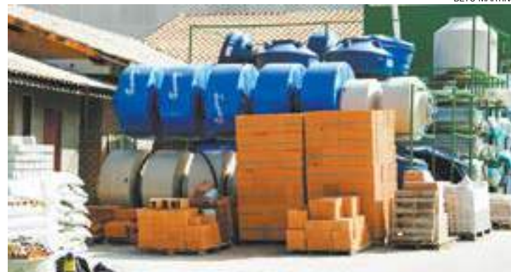
Estoque - Especialista avalia que recuperação do setor ainda é tímida