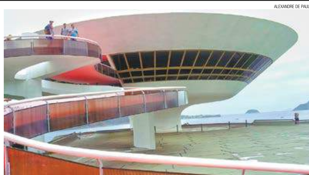
Futurista - Museu de Arte Contemporânea (Niterói-RJ), obra do arquiteto Oscar Niemeyer (1907-2012)