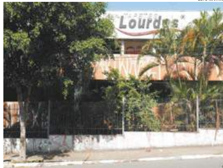
Nova sede - Antiga fábrica de tapetes foi adquirida para abrigar a Câmara