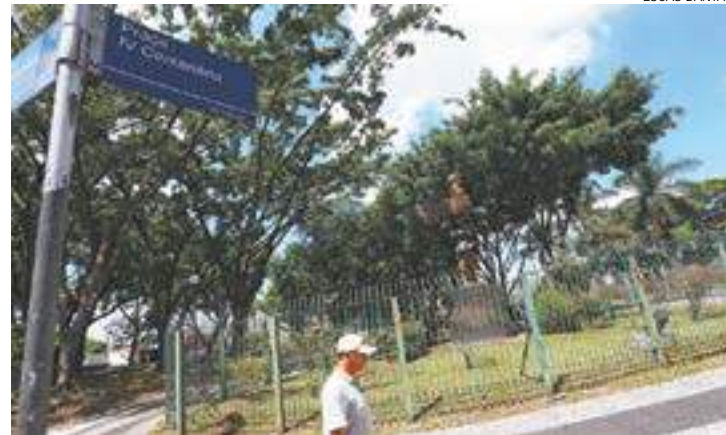
Marco - Praça IV Centenário será palco da cerimônia de abertura, hoje

DA REDAÇÃO - Resultado de uma parceria entre a Prefeitura de Guarulhos e a Secretaria Estadual de Turismo de São Paulo, o programa Turismo na Praça busca estimular o fluxo turístico regional nos municípios paulistas. A Praça IV Centenário, na região central de Guarulhos, será a primeira a receber esse programa inédito no Estado. A cerimônia de abertura do evento acontecerá hoje, a partir das 12h, com a participação do Grupo de Metais de Tatuí.