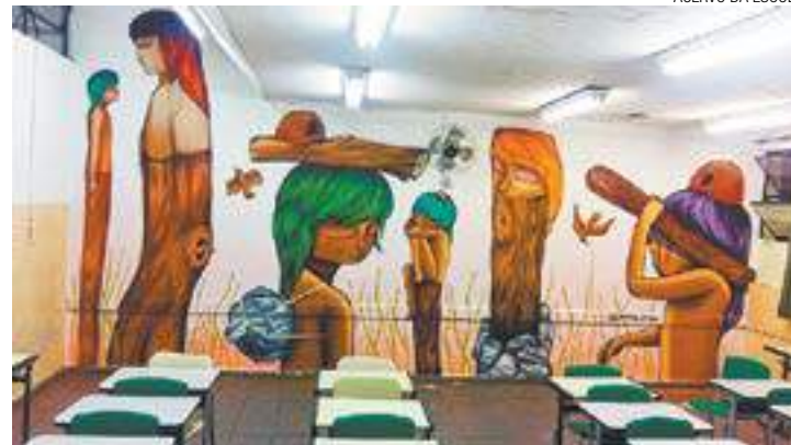
Galeria - Objetivo é colorir e disseminar a arte entre crianças e jovens