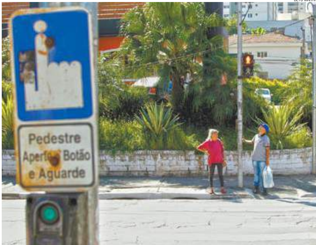
Dúvida - Apreensivos, pedestres verificam o funcionamento do semáforo em trecho da Avenida Paulo Faccini

Em nota, a Prefeitura informou que "em atenção aos questionamentos, a Secretaria de Transportes e Trânsito (STT) informará que enviará equipes técnicas aos locais para verificar e tomar as medidas necessárias."