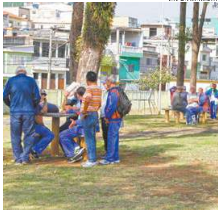
Problema - Em 2016, idosos aguardaram chegada de ônibus por sete horas

Inscrições para a Olimpíada da Melhor Idade de Guarulhos 2017 Secretaria de Educação, Cultura, Esporte e Lazer (Secel). Rua Claudino Barbosa, 313, no Macedo. Até 19 de maio.