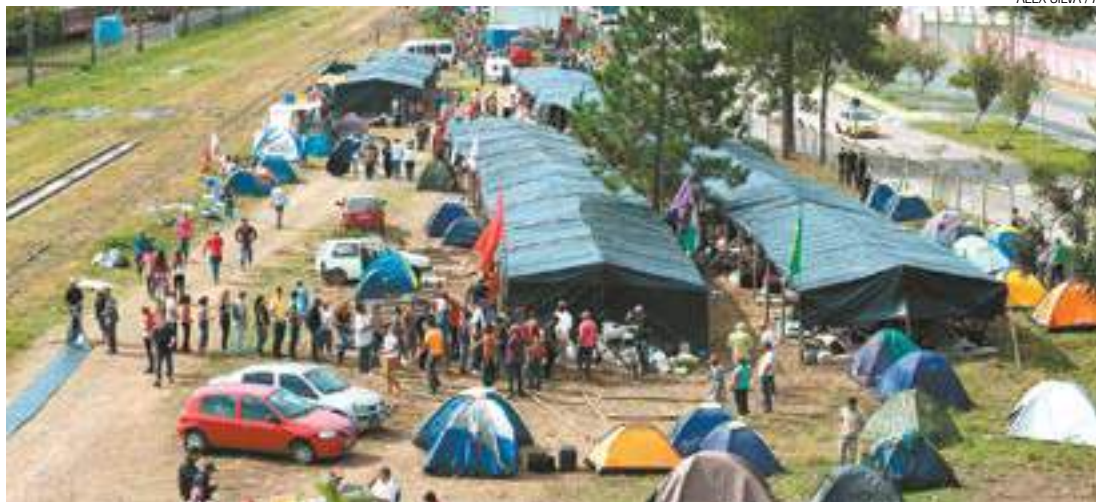
Apoio - Milhares de pessoas vão participar de atos, hoje, em Curitiba, pela defesa do ex-presidente Lula

100 mil páginas é a quantidade de documentos anexados pela Petrobras na ação