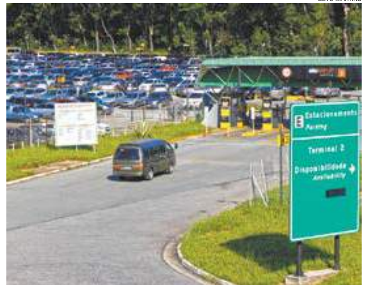
Negócio - Espaço no aeroporto tem capacidade para até 10 mil vagas