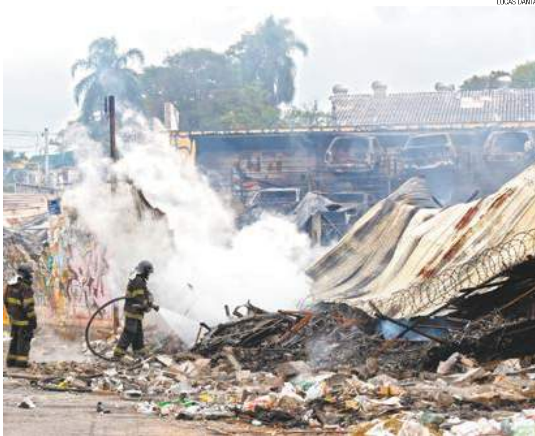
Fogo - Trecho da avenida foi bloqueado na parte da manhã para que os bombeiros realizassem o rescaldo

A Avenida foi bloqueada na parte da manhã pela Secretaria de Transportes e Trânsito (STT), para que os bombeiros realizassem o rescaldo. O local foi interditado. (ALFREDO HENRIQUE)