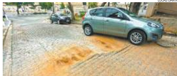
Perigo - Desnível na rua de paralelepípedo pode provocar acidentes