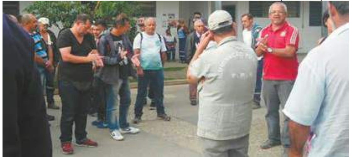
Corpo a corpo - Sindicalistas abordam servidores e tentam convencê-los a aderirem à paralisação da categoria