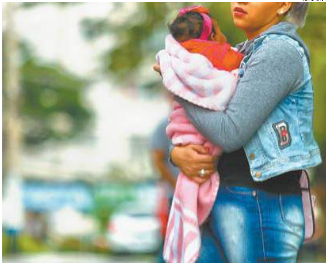
Friozinho - Clima temperado da estação costuma ter temperaturas mais baixas nos fins de tarde e à noite

Karen acrescentou que a procura por ajuda durante os plantões no pronto-socorro onde atende dobra e até triplica nesta época do ano. (ALFREDO HENRIQUE)