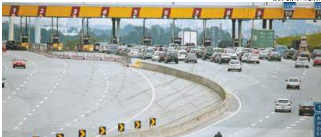
Campanha - Praça de pedágio em Arujá terá distribuição de 50 mil folhetos informativos alusivos ao tema

Dados divulgados em abril de 2017 pelo Disque-Denúncia da Secretaria de Direitos Humanos da Presidência da República apontam que as crianças e os adolescentes são os grupos cujas violações de direitos humanos sofridas, em 2016, tiveram mais casos denunciados por meio do Disque 100. Das 133 mil denúncias recebidas pelo canal no ano passado, 76 mil atendimentos (58% do total) se referem a essa faixa etária. (DA REDAÇÃO)