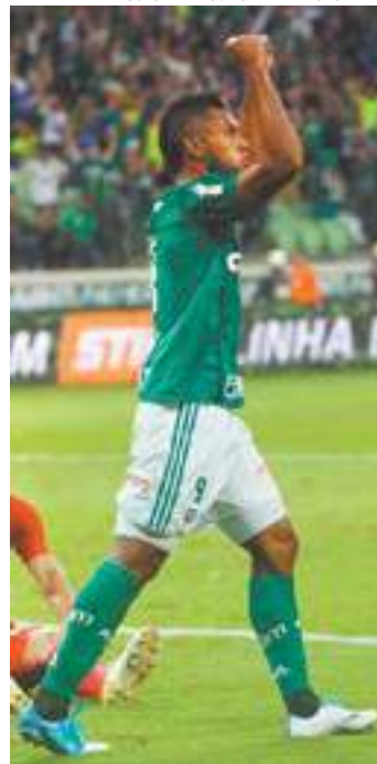
Contraponto - Borja comemora gol contra marcado pelo Colorado

No segundo tempo, o Palmeiras conseguiu se proteger melhor e praticamente não deixou o Internacional jogar. E ainda levava perigo com a velocidade dos seus atacantes. Um empate garante a vaga nas quartas. (AGÊNCIA ESTADO)