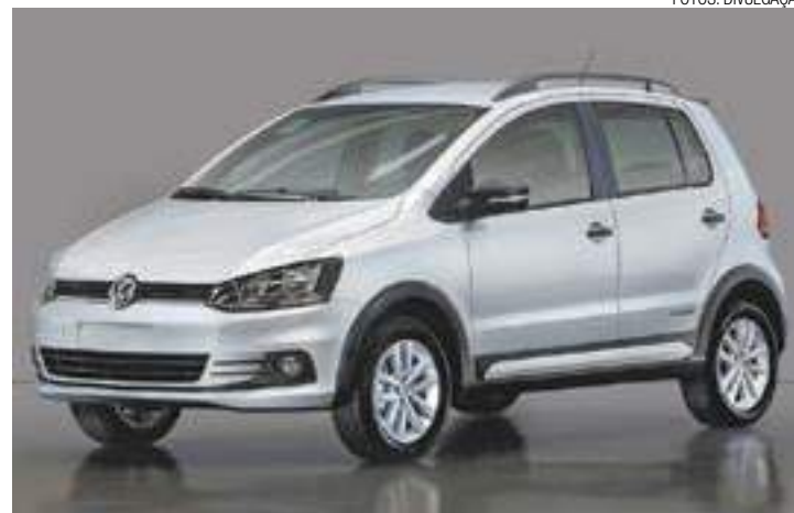
Track - Versão está disponível com a motorização 1.0 com 82 cv de potência

Outras novidades da linha 2018 são as ofertas da roda de liga leve de 16 polegadas com novo visual (estilo "Thor") para o Fox Highline e para todas as versões da cor "Branco Puro" (a mesma disponível na linha Golf). O figurino e os revestimentos dos bancos também são novos em todas as configurações da linha 2018. (DA REDAÇÃO)