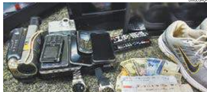
Apreensão - Pertences foram localizados em quatro barracos diferentes

Após a abordagem policial, uma das mulheres confessou o crime e a participação dos colegas e levou os policiais até a Rua Nossa Senhora Aparecida, no Jardim Felicidade, Zona Norte de São Paulo. Com o apoio de mais viaturas, os pertences roubados foram localizados em quatro barracos diferentes de uma comunidade conhecida como Joana D'Arc. A ocorrência foi apresentada no 73º Distrito Policial de São Paulo, no Jaconã. Os assaltantes foram reconhecidos por diversas vítimas do roubo. (EURICO CRUZ)