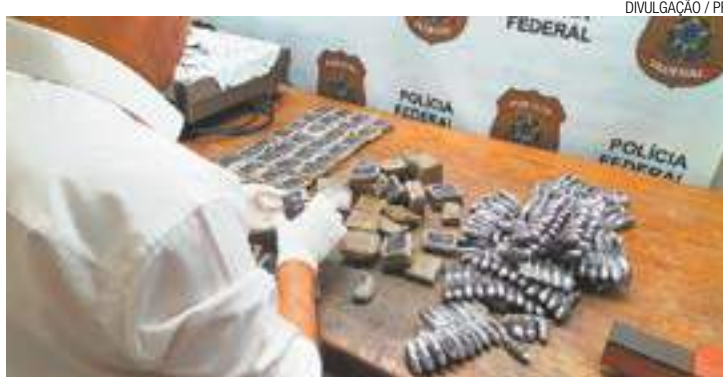
Perícia - Sete quilos de haxixe estavam ocultos na estrutura de uma mala

O caso mais recente ocorreu ontem. Um brasileiro de 29 anos desembarcou de voo proveniente da Itália. Sua bagagem foi submetida ao aparelho de raio-x. Em uma das malas a PF verificou que ha-