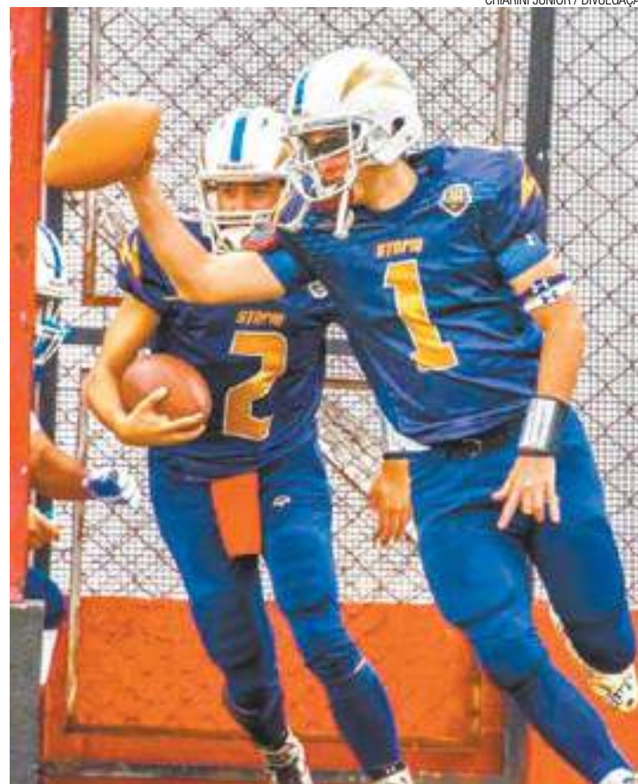
Velocidade - Partidas acontecem no domingo, no Jardim Tranquilidade

lers já foram realizadas sete partidas. Quatro vitórias da "Tempestade" e três dos "Rolos Compressores". O último jogo do Storm foi contra o Diadema. Na partida, realizada no dia 10, válida pela Semana 6, o Storm massacrava o adversário por 20 a 0. Os ingressos estão à venda no site www.sympla.com.br/spfl e custam R$ 20 em promoção. (RAPHAEL POZZI)