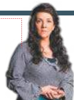
DIVULGAÇÃO / REDE RECORD

Elga desmaia. Asher permanece no calabouço. Nebuzaradã lamenta a morte do pai e pede ritual para Sammu-Ramat. Ravina procura Shag-Shag e dá notícias de Hurzabum. Absalom arranca um beijo de Dana. Daniel encontra Lia ardendo em febre e a leva para piscina do harém. Milagrosamente, ela desperta. Ravina se pergunta sobre o motivo da morte de Chaim. Zac questiona a presença de Shag-Shag no local.