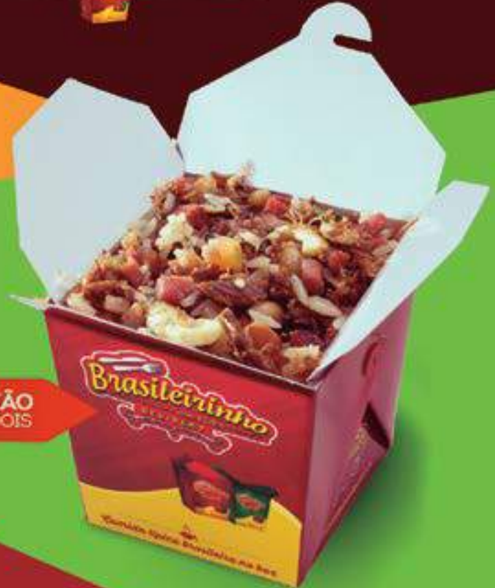
BAIÃO DE DOIS