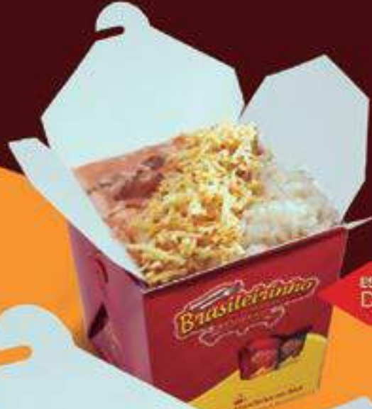
ESTROGONOFE DE CARNE