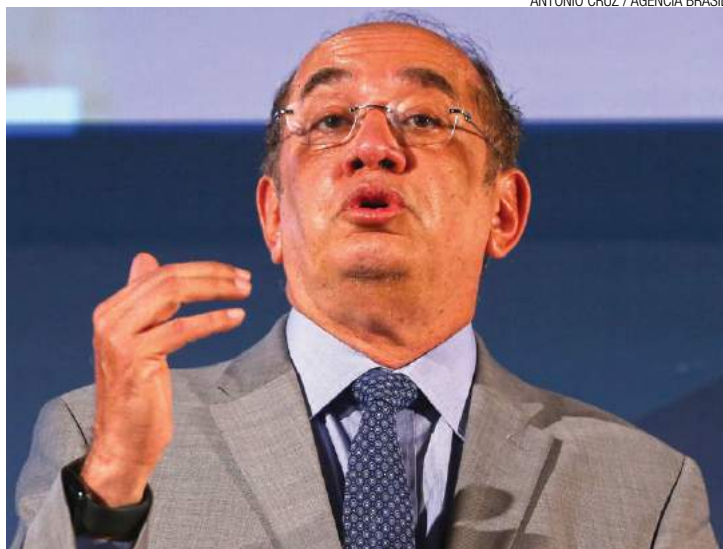
Soltou o verbo - Gilmar Mendes não quer pressão política no julgamento

“Com certeza vai ser um julgamento tranquilo”, avalia Gilmar. “É um julgamen-