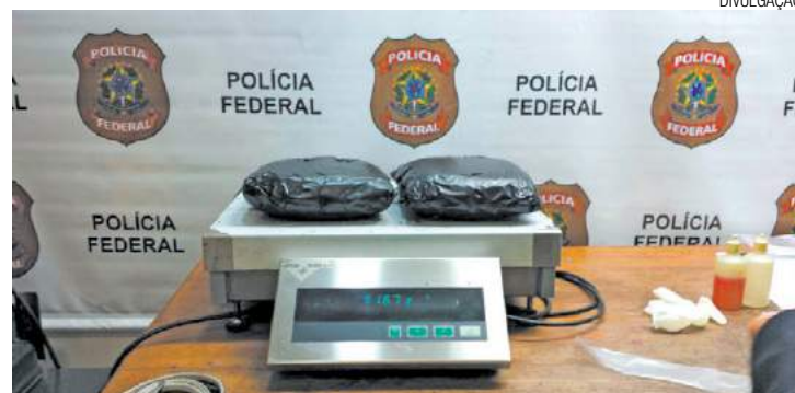
Flagrante - Cocaína escondida por passageiro foi apreendida pela polícia