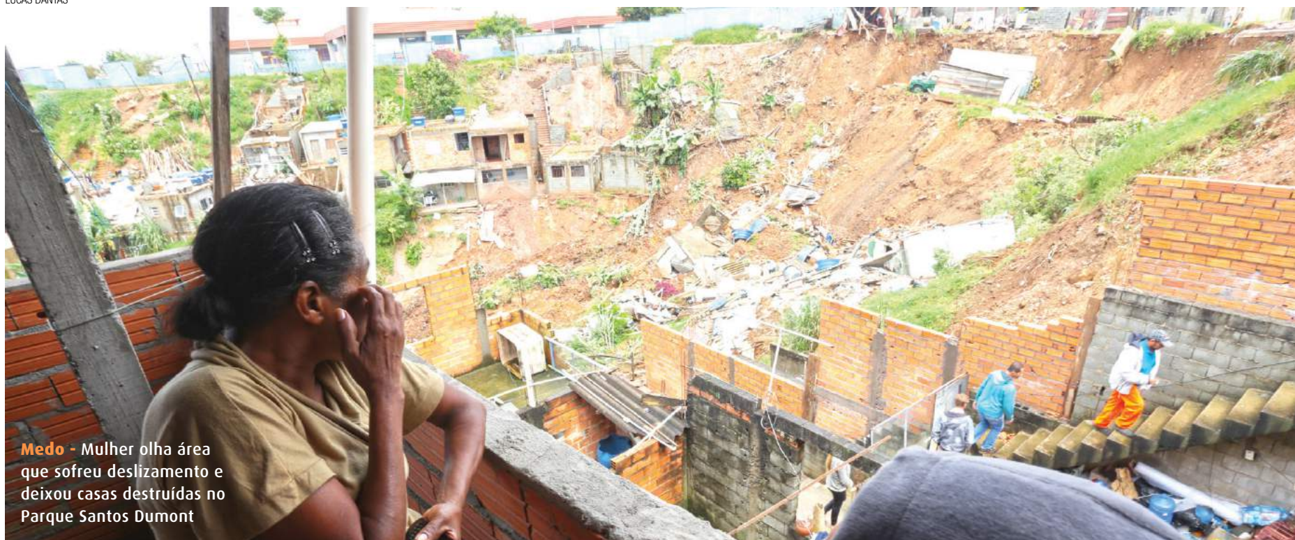
Medo - Mulher olha área que sofreu deslizamento e deixou casas destruídas no Parque Santos Dumont