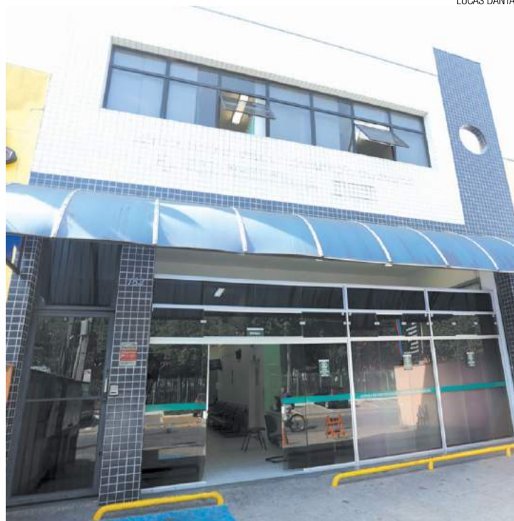
Sem acordo - Nipo realizava 15 mil atendimentos por mês na ortopedia

Gerir tem nove meses para obter alvará da vigilância