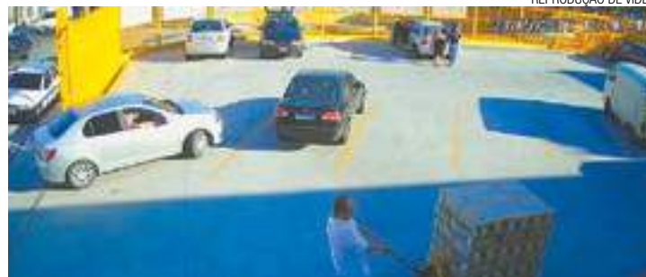
Cena 1 - Carro prata chega ao estacionamento do supermercado