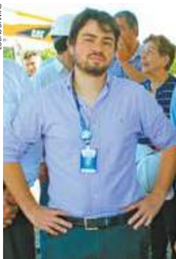
Confiante - Prefeito Guti (PSB) acredita em resolução no período

A declaração do prefeito foi realizada anteontem, ao lado do governador Geraldo Alckmin (PSDB), que esteve em Guarulhos para inauguração da Via Parque do Parque Várzeas do Tietê. “Estamos avançando bastante. Ainda não temos o ponto de convergência, porque a Sabesp calcula um montante da dívida e nós calculamos outro valor”, explicou Guti.