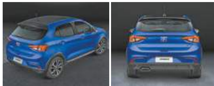
Gama - Sete versões combinando três motores e três tipos de câmbio