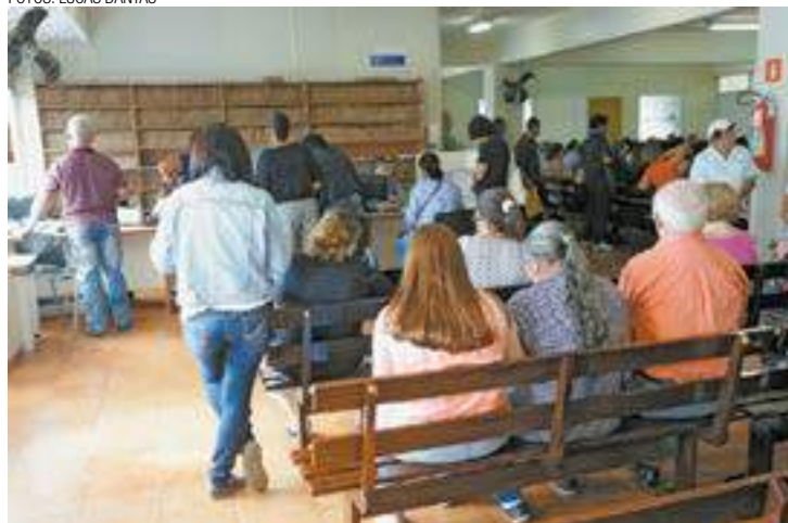
Filantrópico - Hospital atende 80% de seus pacientes pelo SUS