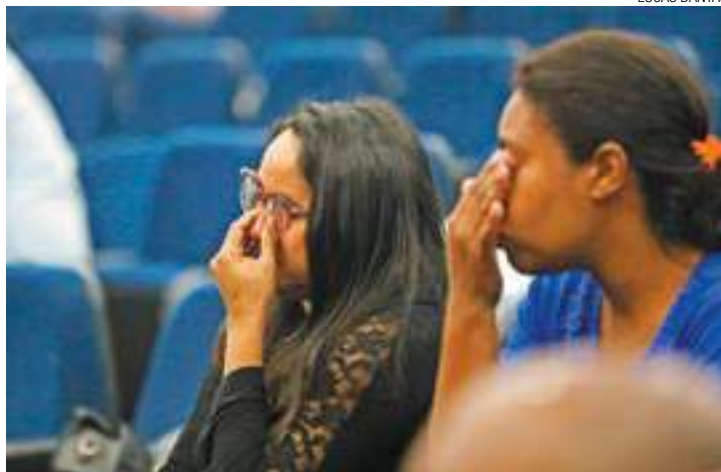
Desespero - Trabalhadoras choraram durante ato de protesto na Câmara