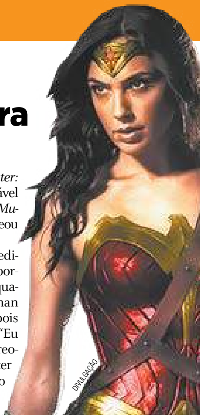
Primeira vez - Mulher Maravilha estrela filme solo feito pela Warner

Gadot, que mostrou um pouco de sua Mulher Maravilha em uma breve e importante participação no filme Batman vs Superman: A Origem da Justiça , ainda está surpresa ao ver seu rosto, sozinho, nos pôsteres de divulgação do longa. Diz ter tomado um susto ao ver sua própria