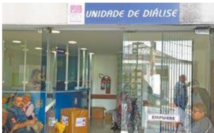
Dificuldade - Déficit mensal é de R$ 1,6 milhão na operação atual