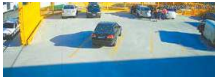
Cena 3 - Heloisa é arrastada à força pela dupla e é colocada no carro