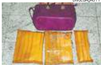
Apreensão - Pacotes com droga estavam em três volumes na bolsa

A presa foi conduzida a um presídio estadual, onde permanecerá à disposição da Justiça. (DA REDAÇÃO)