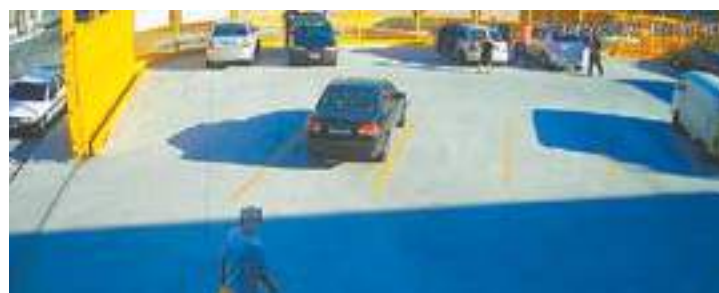
Cena 2 - Homens desembarcam do veículo e se aproximam da vítima