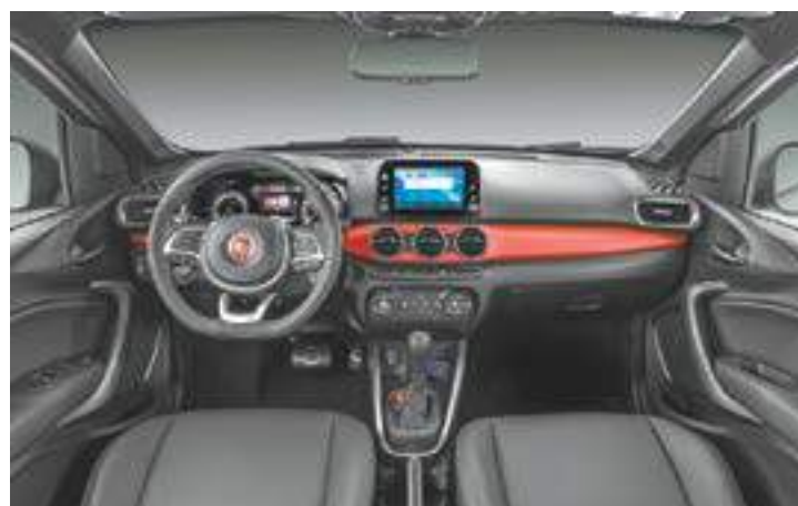
Interior - Central multimídia Uconnect com Apple CarPlay e Android Auto