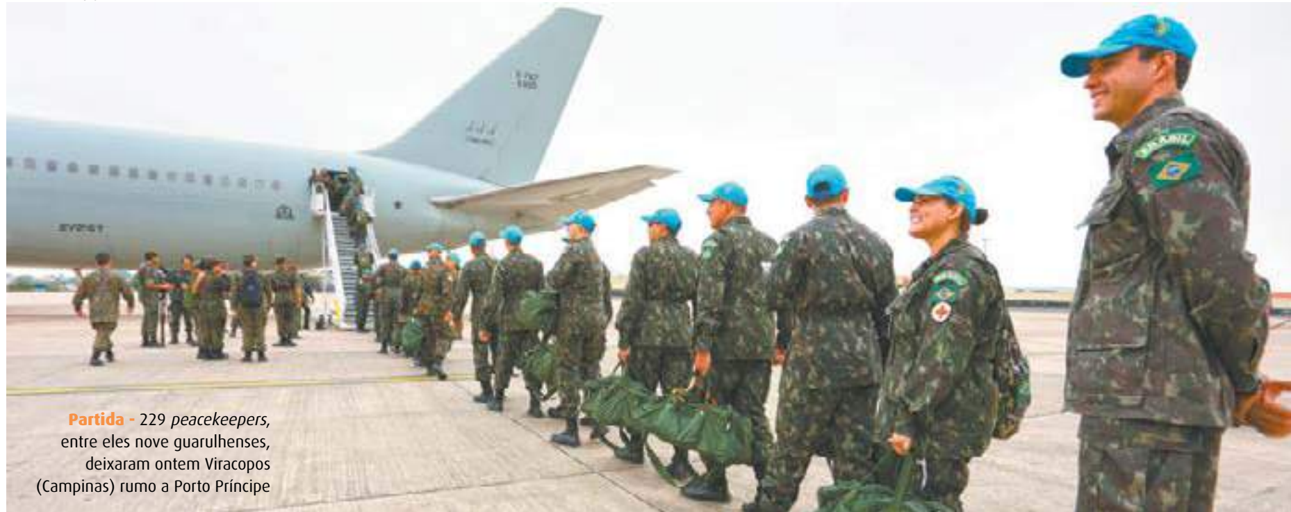
Partida - 229 peacekeepers, entre eles nove guarulhenses, deixaram ontem Viracopos (Campinas) rumo a Porto Príncipe

Guarulhenses embarcam para última Missão de Paz brasileira no Haiti