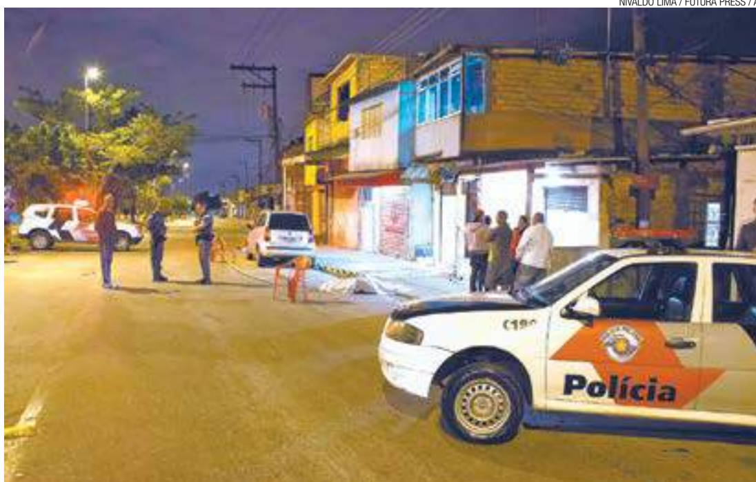
Violência - Policiais militares preservam a cena do crime para que possa ser periciada; clima é de medo

Segundo a polícia, os criminosos chegaram caminhando ao local da chacina e atiraram diversas vezes. O crime ocorreu por volta da 1h30. O caso foi registrado no 7º DP (Região São João). (ALFREDO HENRIQUE)