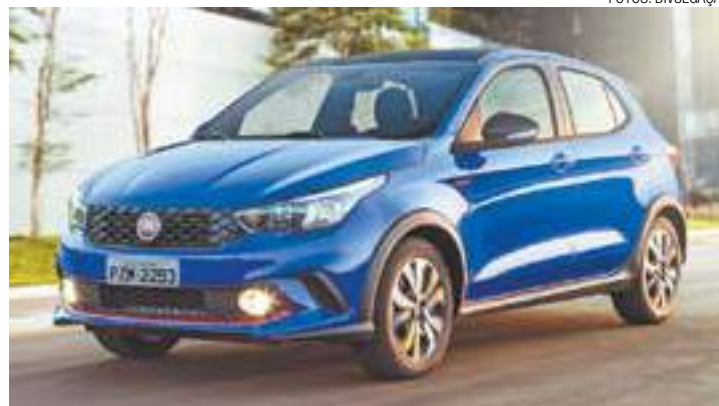
Design - Capô longo e volumoso demonstra sua imponência e presença

O Fiat Argo é fruto de um grande investimento da Fiat Chrysler Automóveis (FCA) na modernização do Polo Automotivo de Betim (MG), com foco na excelência construtiva. Ele representa um novo ciclo de renovação na consagrada gama Fiat, depois de um período em que a marca investiu em segmentos nos quais ainda não estava presente, como o de picapes maiores (Toro) e hatches subcompactos (Mobi). (DA REDAÇÃO)