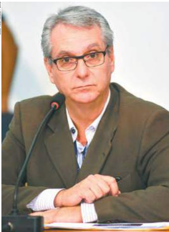
Empresário - Dias foi um dos últimos secretários a ser anunciado por Guti