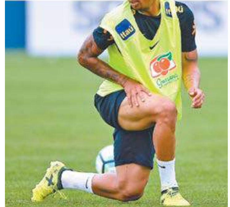
Lugar cativo - Gabriel Jesus está confirmado no ataque da Seleção

CLASSIFICADOS TUDO AQUI - Anuncie 2475-7810 / 4965-9430