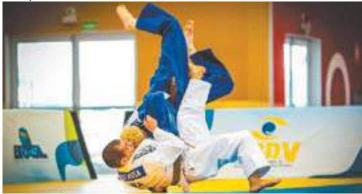
Campeão - Judoca conquistou no dia 26 o torneio Panamericano