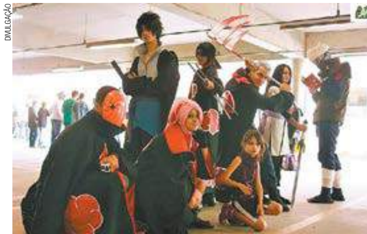
Cosplay - Pessoas fantasiadas de personagens vão desfilarem pelo evento