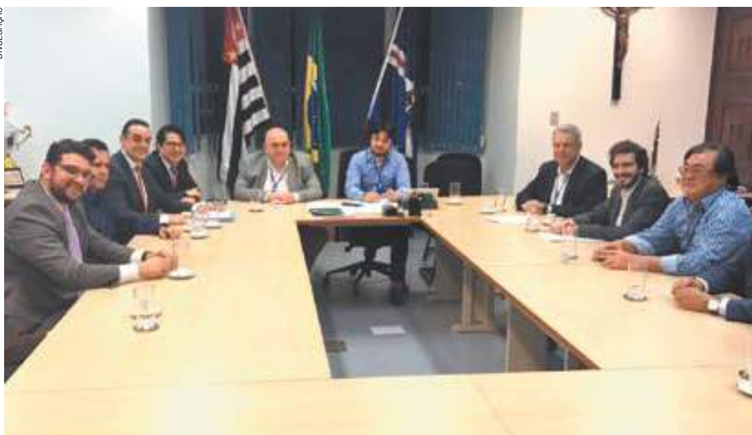
Débito - Autarquia deve atualmente R$ 2,9 bilhões à estadual, que fornece 87% da água consumida na cidade

Parcelas terão juros de 0,5% e correção do IPCA