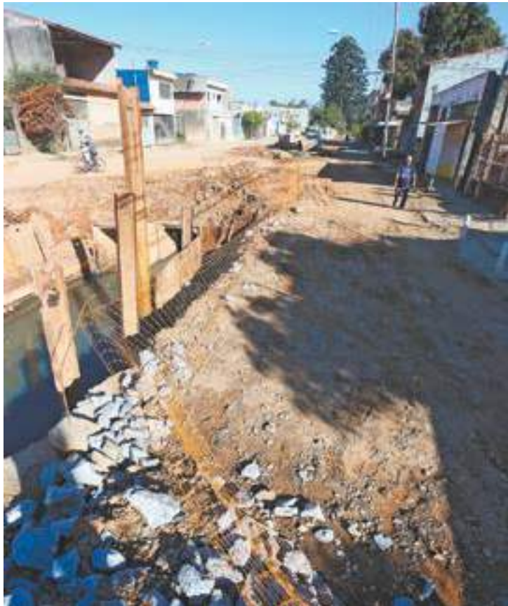
Transtorno- Obra parada prejudica tráfego de carros e pedestres