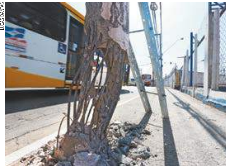
Gambiarra - Quase um metro da estrutura está sem concreto e torta

A empresa realizou uma ação preventiva, apenas para que o poste não fique sustentado só por "fios". Funcionários colocaram dois ferros, apoiados na calçada. Isso, no entanto, ainda traz insegurança para os comerciantes e pedestres que passam por lá. Quase um metro da base do