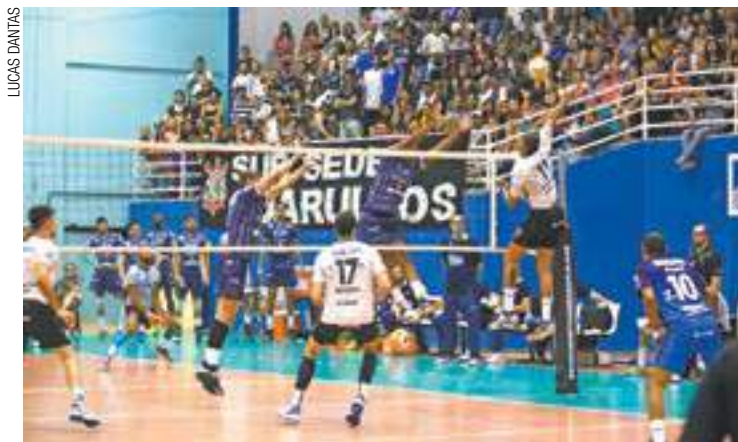
Recuperação - Equipe da cidade vence após duas derrotas seguidas

ta com duas vitórias e duas derrotas no Paulista. Os atletas conseguiram ganhar do Atibaia, fora de casa, na primeira rodada. Porém, no segundo e no terceiro jogo, o Corinthians foi superado pelo Vôlei Renata (em casa) e pelo Sesi (em Santo André).