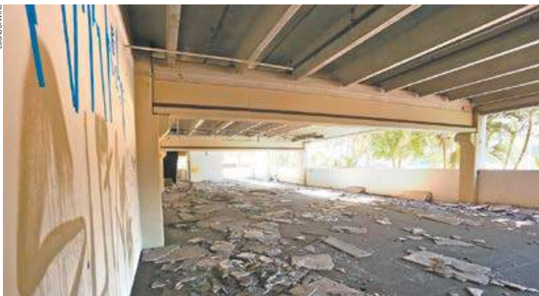
Concorrência - Outros dez interessados encaminharam propostas para revitalizar imóvel adquirido em 2011

Empresa venceu a disputa com valor de R$ 196.428,60