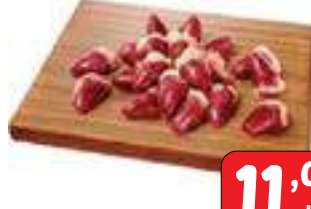
Coração de Frango