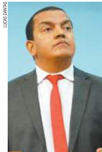
Atuação - Souza disse que Casa de Leis perdeu o protagonismo

do Carneiro negou tal situação. “Eles que querem debater qualquer requerimento por mais simples que seja e travam a sessão. No nosso governo, quem for investigado será afastado”, retrucou. (EC)