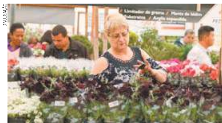
Variedade - São mais de 200 tipos de flores, sendo 60 orquídeas

Esta é uma das maiores festas de flores que acontecem no Estado. A feira é roteiro turístico conhecido das pessoas que