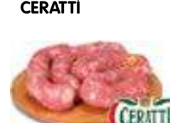
LINGUIÇA SUÍNA - CERATTI