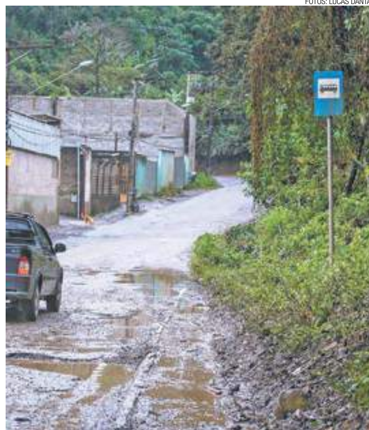
Abandonado - Parada de coletivos fica em calçada tomada por matos