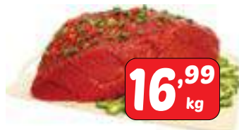
Coxão mole peça/pedaço/bife