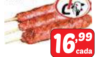
Espetinho de Linguiça 1KG - TC