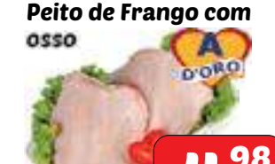
Peito de Frango com OSSO