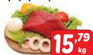
Coxão Duro peça/pedaço/bife