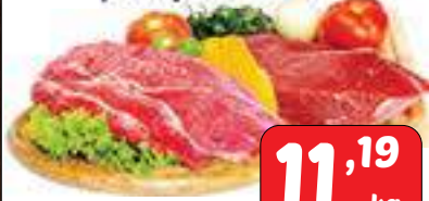
Acém ou Paleta Bovina peça/pedaço

São mais de 25 mil itens para você aproveitar os melhores preços