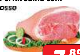
Pernil Suíno com OSSO