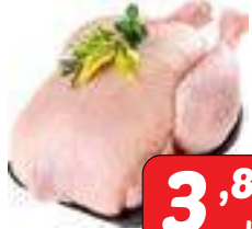
Frango inteiro congelado ou resfriado