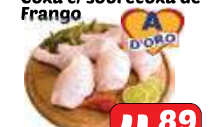
Coxa c/ sobrecoxa de Frango