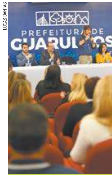
Meta - Guti quer arrecadar meio milhão de peças no próximo ano

Para o ano que vem, a meta da Prefeitura é arrecadar 500 mil peças, quase o