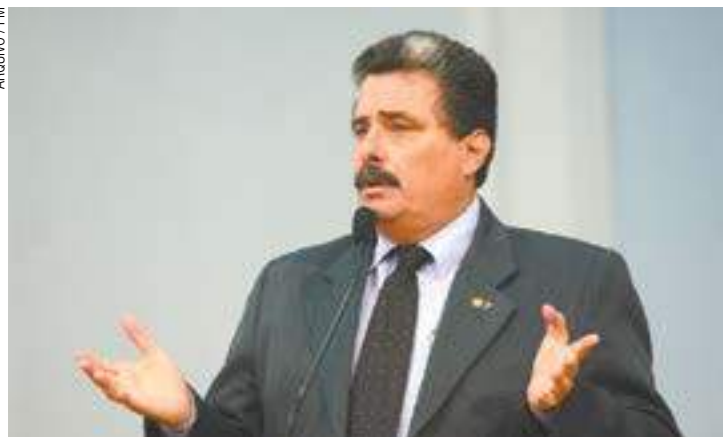
Regra - Ao se tornar secretário, político descumpriu norma do Democratas

Ofício será enviado à zona eleitoral para atualização