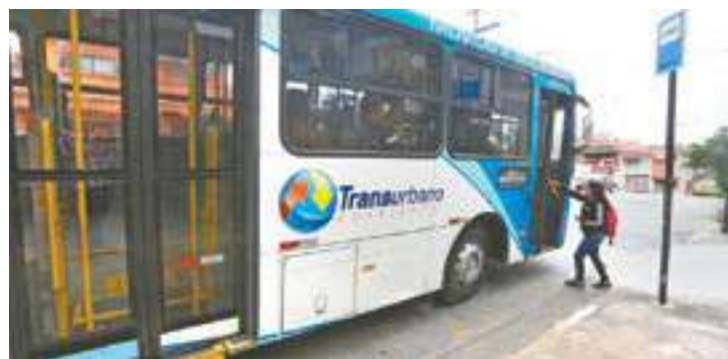
Perrengue - Passageiros entrevistados classificam pontos como “ruins”