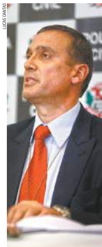
Chefia - Delegado Adilson Aquino coordena a Polícia Civil na cidade

Segundo o delegado seccional, Guarulhos é a cidade mais produtiva da Grande São Paulo. “Nossas ações, como 1,7 mil interceptações telefônicas, além de operações de combate ao roubo de carga, por exemplo, dão nisso (resultados positivos)”, afirmou. (ALFREDO HENRIQUE)