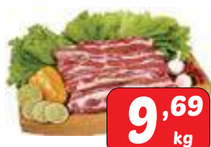
Costela Bovina P.A