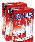
LEITE UHT 1L - HÉRCULES