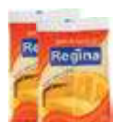
QUEIJO PARMESÃO RALADO 50G - REGINA