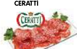
SALAME ITALIANO - CERATTI