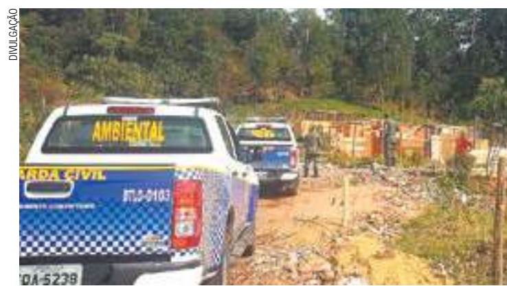
Flagrante - Equipes da GCM Ambiental autuam ocupação em área ilegal

Guarda Ambiental conta com atuação de 31 GCMs