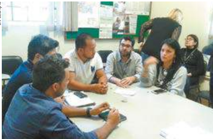
Diálogo - Prefeitura quer intermediar acordo entre proprietários e invasores

Anteontem, o movimento realizou uma passeata com mais de 3 mil pessoas. A concentração começou na Praça Getúlio Vargas e terminou na Secretaria de Habitação, na Vila Fátima. O intuito da ação era cobrar um posicionamento do Governo na demanda habitacional de mais de 10 mil famílias que participam da ação do MTST.