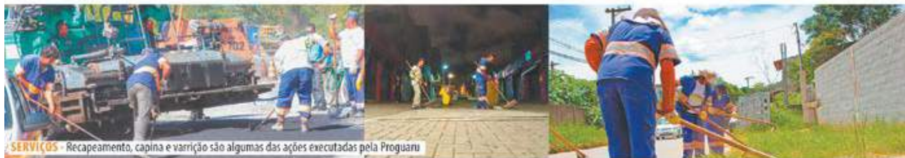
SERVIÇOS - Recapeamento, capina e varrição são algumas das ações executadas pela Proguaru

Os cidadãos também podem acompanhar os trabalhos realizados diariamente pela empresa por meio do site: www.proguaru.com.br