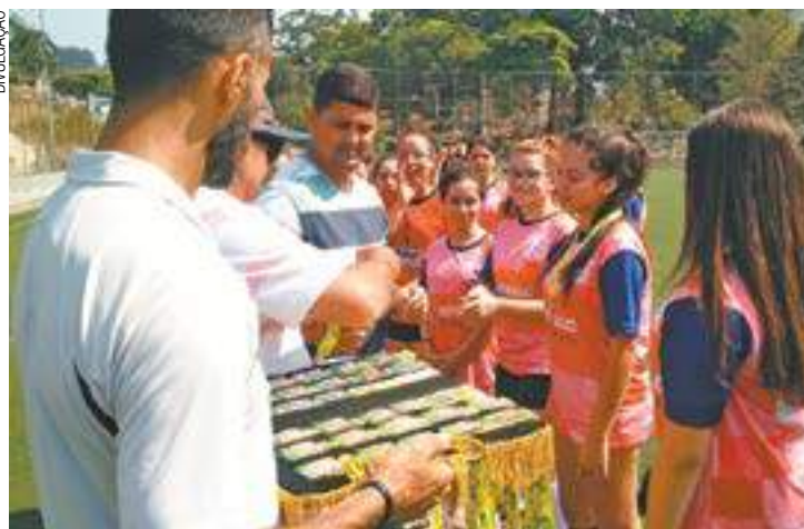
No topo - Meninas do futebol feminino do Eniac recebem premiação

Hoje é dia de várias finais. O ginásio do Sesi recebe os jogos decisivos de handebol masculino. Às 10h20, pelo pré-mirim, Autêntico e Parthenon. Às 11h, é a vez do Eniac e Parthenon, pelo mirim. Às 11h40, entram em quadra EE Prefeito Antônio Práticos e EE Professor José Ro-