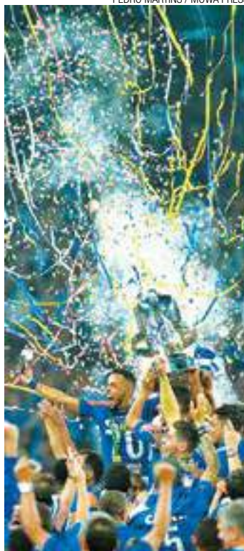
Emoção - Cruzeirenses levantam a quinta taça da Copa do Brasil

Nas penalidades, o Cruzeiro converteu todas as suas cinco cobranças, enquanto que o Flamengo perdeu uma delas, com Diego, em defesa do goleiro Fábio. O resultado garantiu ao time mineiro seu quinto título da Copa do Brasil. (AGÊNCIA ESTADO)