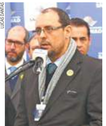
Em alta - Zeitune é um dos poucos políticos da Rede em cargo executivo

A sigla reforçou ainda que a decisão do quadro político das próximas eleições se dará pela Rede Susten-