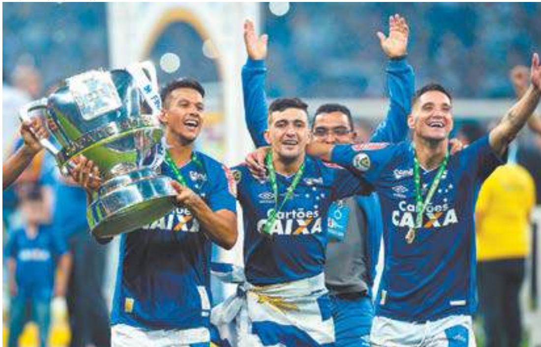
Alívio - Jogadores fazem a volta olímpica depois de partida truncada contra o Flamengo, ontem, no Mineirão